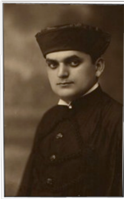
Câmara Cascudo, autor do livro Dicionário do Folclore Brasileiro, que se tornaria uma referência do assunto.

A Comissão Nacional do Folclore foi fundada em 1947, por Renato de Almeida, sendo uma entidade