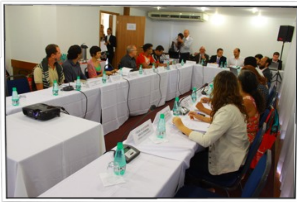
Reunião do Colegiado de Culturas Populares em 22 de Novembro de 2010, em que o plano foi aprovado.

A existência de culturas diferentes, às vezes