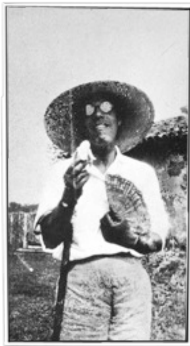
Mário de Andrade, um dos idealizadores do Departamento Municipal de Cultura de São Paulo.

históricas de Minas Gerais e sua arte barroca. Com uma visão ampla sobre o país, engajou-se de corpo e alma na administração pública na área da cultura. Em 1935, por sugestão de Mário de Andrade, Paulo Duarte e outros intelectuais da época, o então prefeito de São Paulo, Fábio Prado, criou o Departamento Municipal de Cultura. Até onde se sabe, este foi o primeiro órgão público brasileiro destinado exclusivamente a cuidar das questões culturais. Esse Departamento tinha como objetivo: