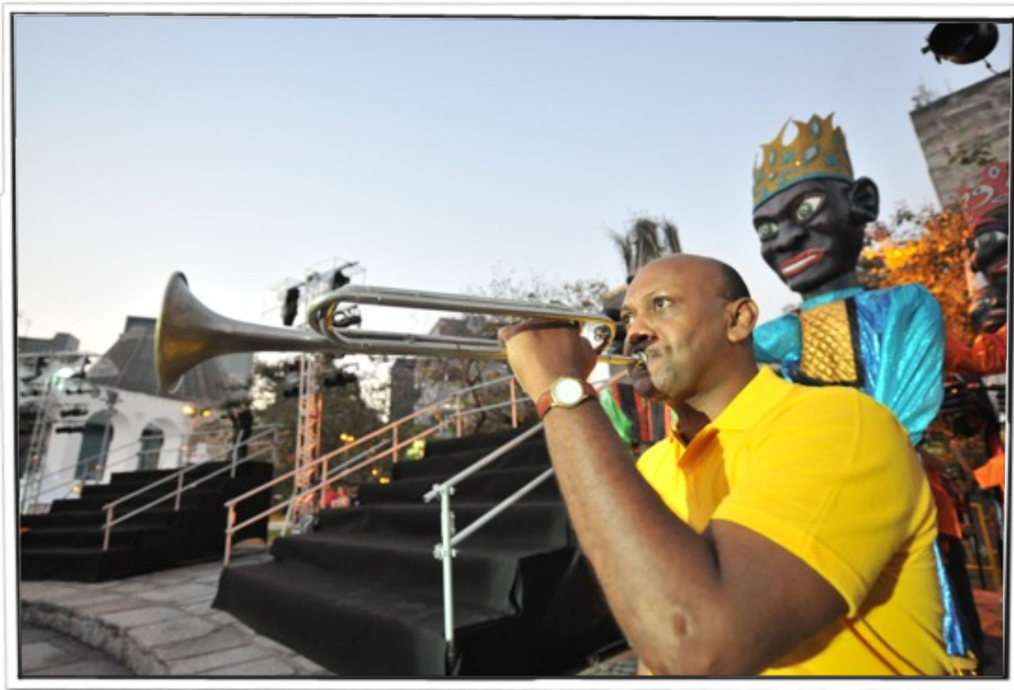
Clarim de Olinda no primeiro dia do Encontro da Diversidade.

diversidade biológica como elemento essencial à manutenção da diversidade cultural desses segmentos. O artigo 7º desse texto define: