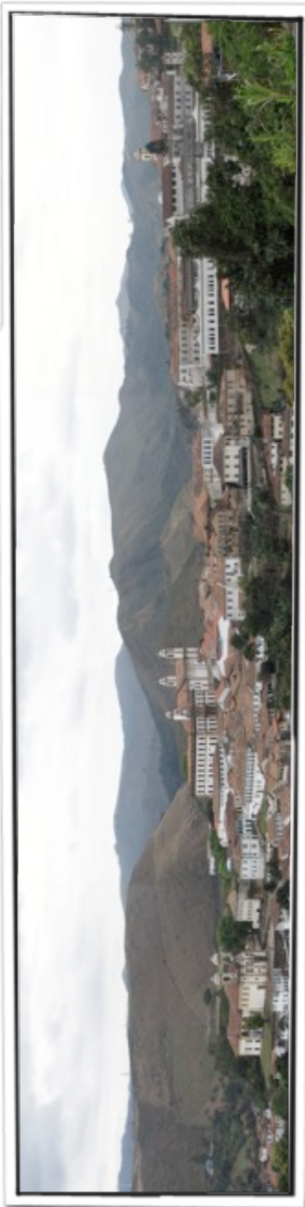
Cidade de Ouro Preto, em Minas Gerais. "patrimônio mundial".

populares, tendo como premissa que para o integral exercício da cidadania dos indivíduos pertencentes a essas culturas, é preciso fazer valer todos os direitos tidos como fundamentais e estabelecidos na Constituição Federal brasileira e nas convenções e declarações internacionais de direitos humanos, com ênfase nos textos legais relativos à preservação da diversidade cultural.