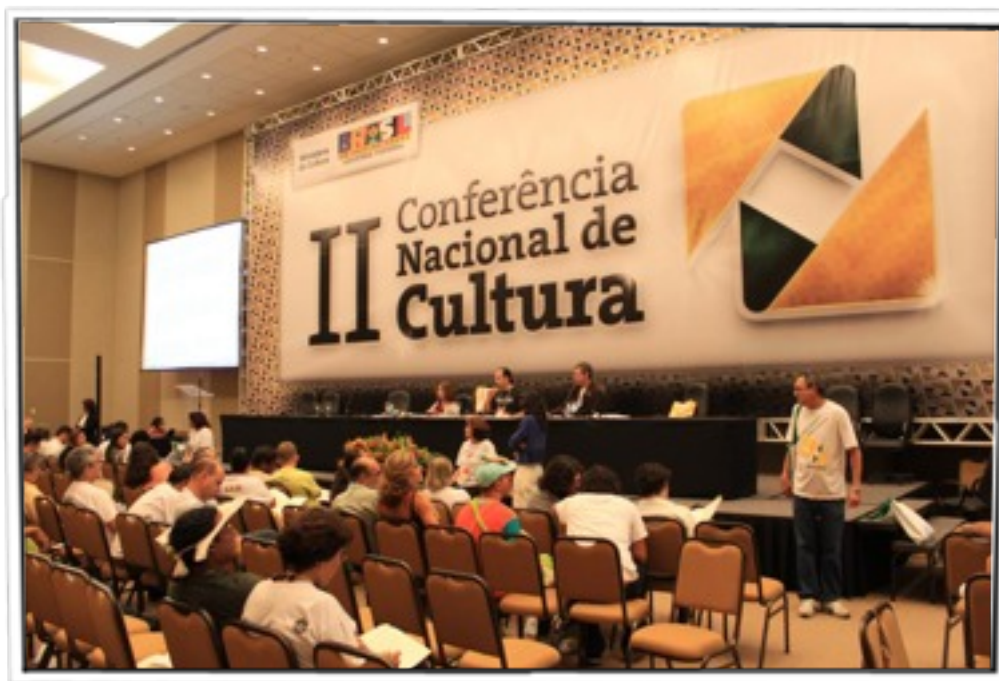
A II Conferência Nacional de Cultura aconteceu em março de 2010 e foi uma agregadora de propostas para os planos.

instrumentos 1 , permitirá consolidar uma política de cultura para o Brasil, por meio do pacto federativo realizado pelo Sistema Nacional de Cultura, que prevê a existência, em todos os estados e municípios, de conselhos de cultura; Fundos Setoriais específicos para o fomento de projetos da sociedade civil, entre eles o Fundo Setorial de Acesso e Diversidade; e o Sistema Nacional de Informações e Indicadores Culturais, SNIIC.