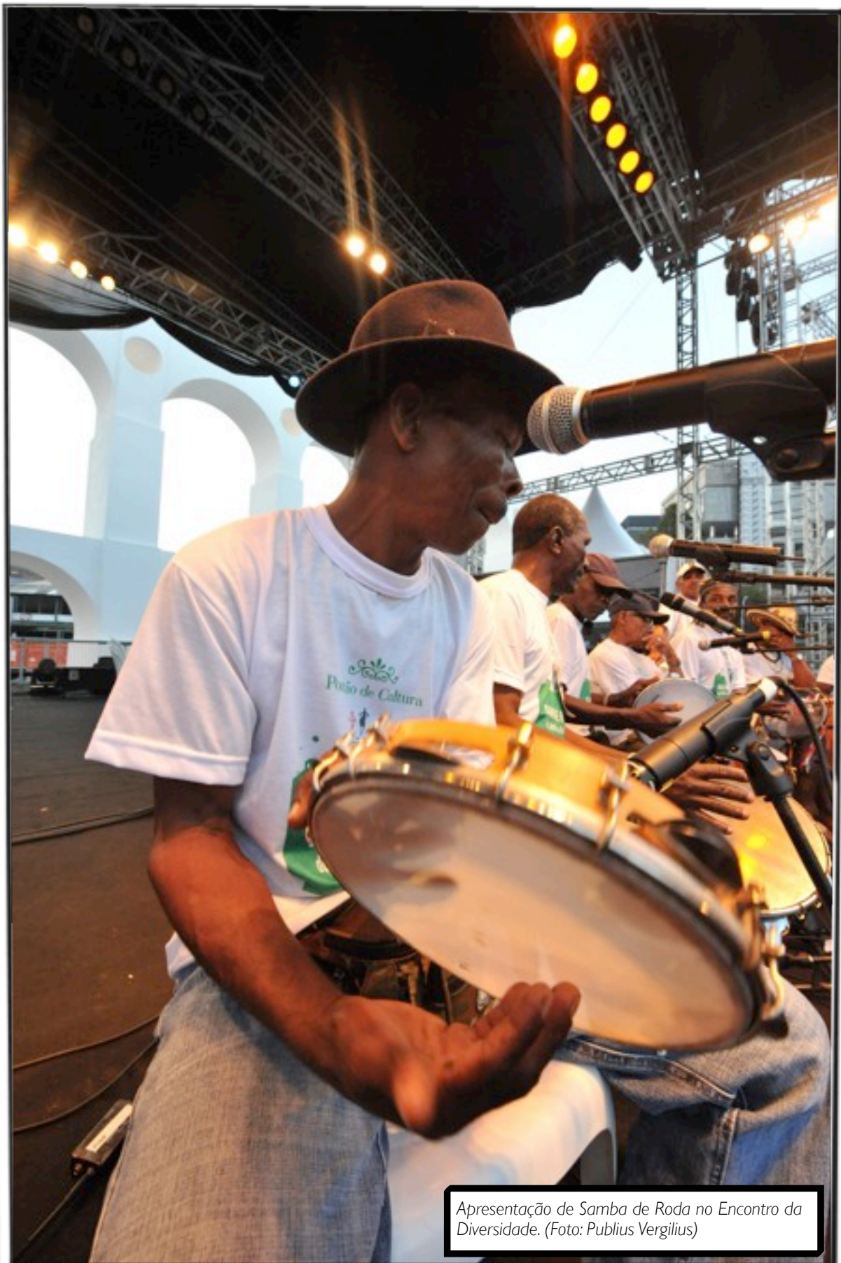
Apresentação de Samba de Roda no Encontro da Diversidade.