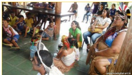
Foto ilustrativa do encontro no projeto Oca Digital

Arquivado em Notícias, REDE DOS PONTOS DE CULTURA DO BRASIL, TEIA DA DIVERSIDADE 2014 com as tags #teiadiversidade2014, cidadania, Cultura viva, pontos de cultura, pontos de cultura indígena do NE, pontos de cultura indígenas.