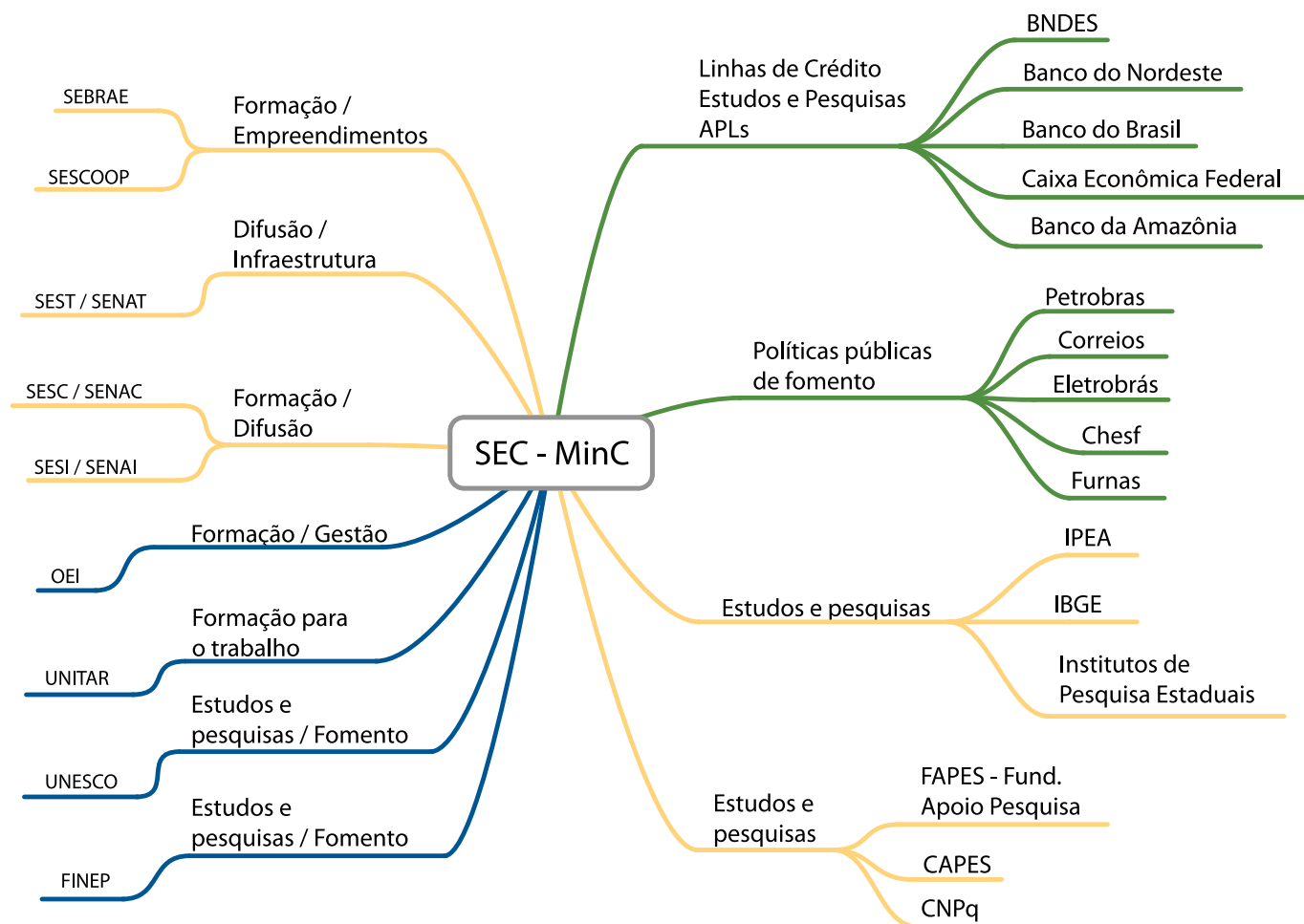
FIGURA 11: Articulações intersetoriais com parceiros institucionais, agências de fomento e desenvolvimento, órgãos bilaterais e multilaterais