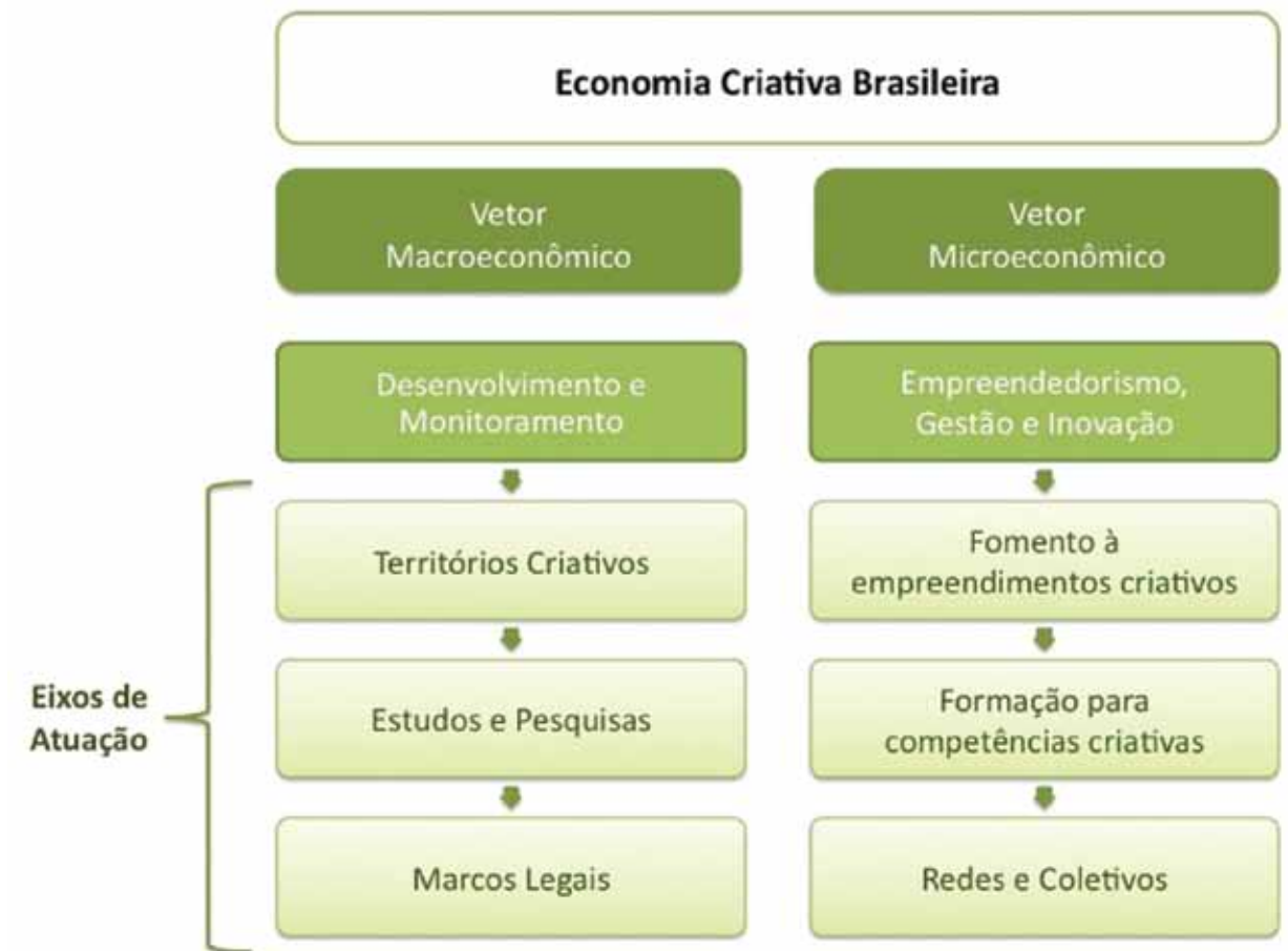
FIGURA 9: A economia criativa brasileira - vetores e eixos de atuação

Na FIG.9 a seguir, é apresentada uma síntese dos vetores e eixos de atuação da Secretaria da Economia Criativa.