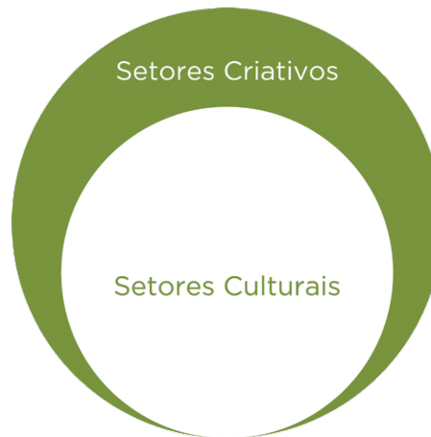
FIGURA 1: Setores criativos – a ampliação dos setores culturais

É de se ressaltar que, mesmo antes da ideia de criação da Secretaria da Economia Criativa, o MinC já atentava para a importância dessa temática. Assim, passou a estender sua atuação para além dos setores tradicionalmente considerados como culturais. Por isso, incluiu o eixo Economia Criativa para construção de estratégias setoriais na II Conferência Nacional de Cultura, em 2010, com o objetivo de levantar demandas, realizar diagnósticos