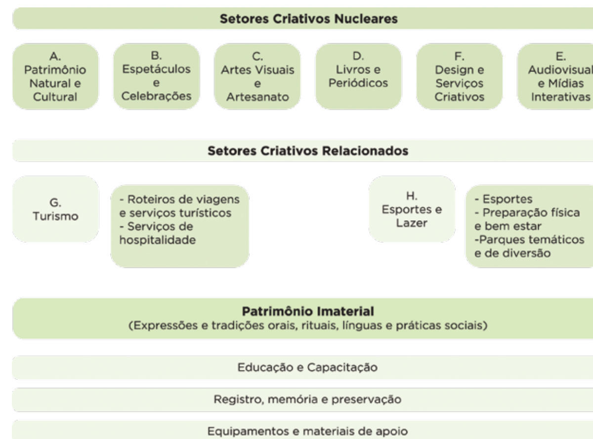
FIGURA 4: Escopo dos Setores Criativos - Unesco (2009)

A seguir, na FIG.5, verifica-se a descrição mais detalhada das atividades que com-