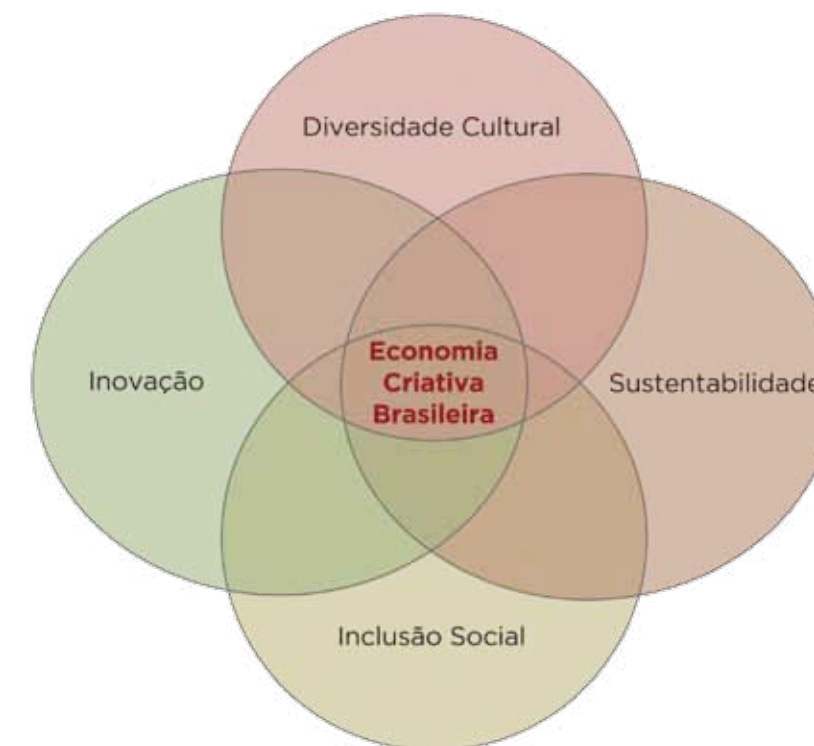
FIGURA 8: A economia criativa brasileira e seus princípios norteadores

Assim, conforme pode ser analisado na FIG.8 a seguir, a Economia Criativa Brasileira se constitui e é reforçada pela intersecção destes princípios.