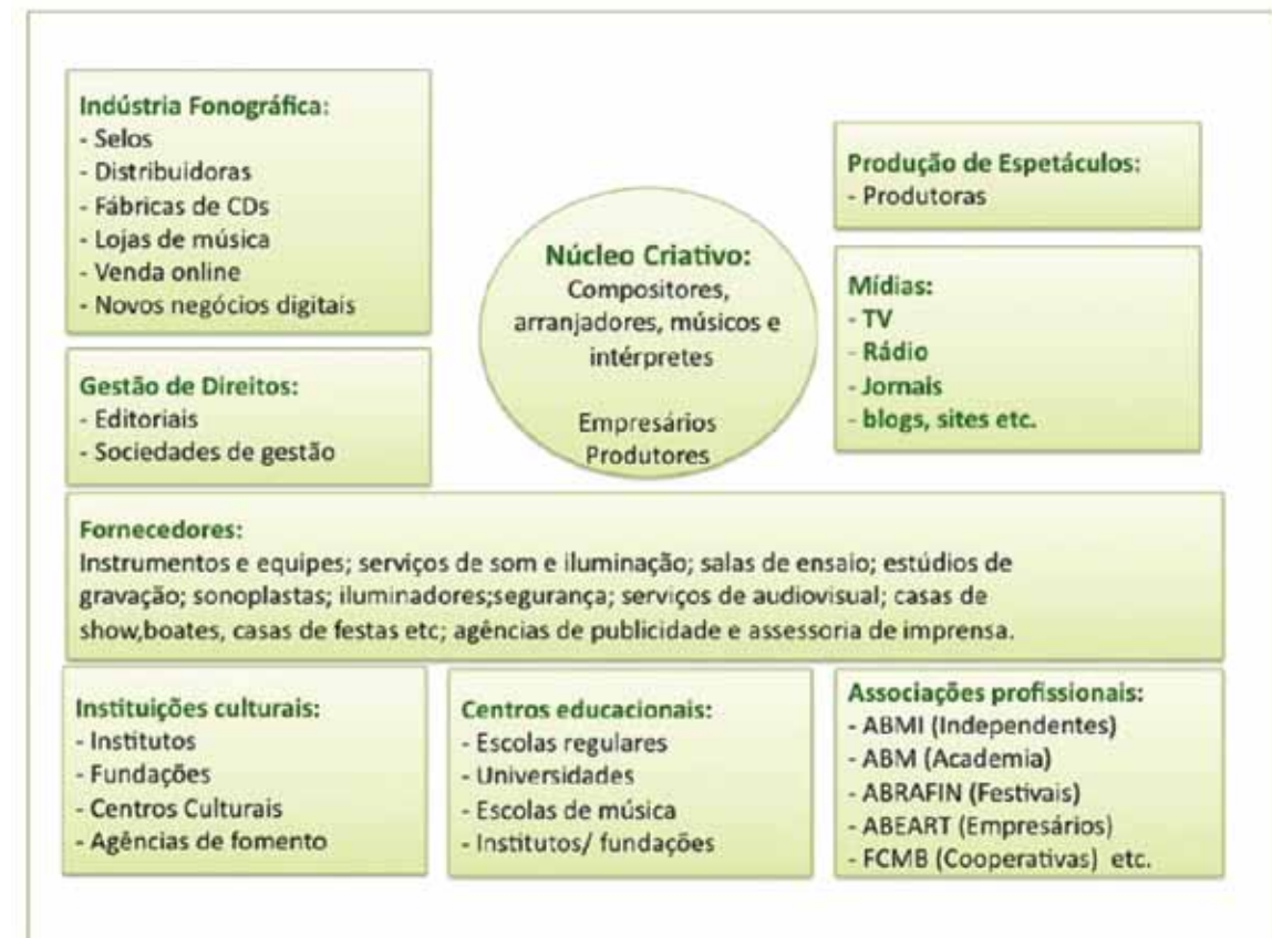
FIGURA 3: Arranjo produtivo da música

O arranjo produtivo da música, apresentado na FIG. 3 a seguir, exemplifica muito bem essa dinâmica, demonstrando os diversos atores que a compõe e que são necessários à otimização do seu resultado final.