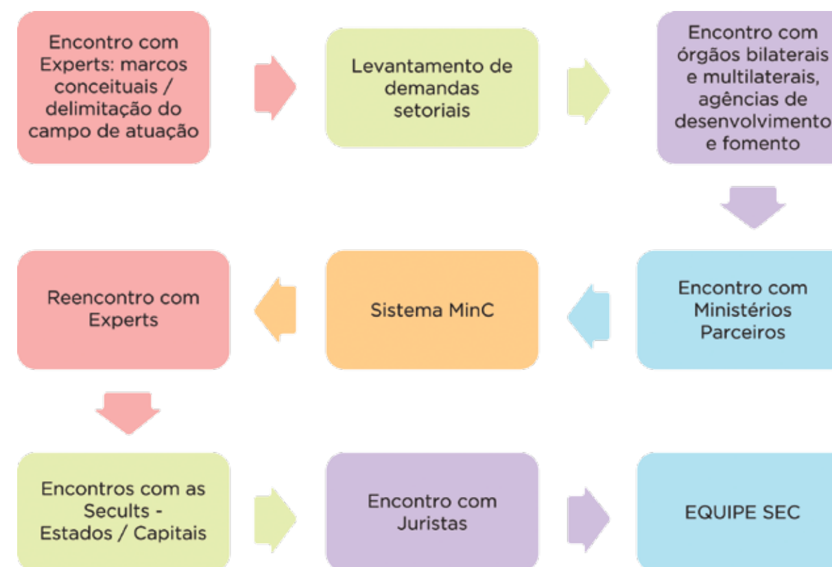
FIGURA 10: Etapas do Planejamento Estratégico da Secretaria de Economia Criativa

Nessa perspectiva, o planejamento estratégico da Secretaria da Economia Criativa resultou em um conjunto de políticas, diretrizes e ações compreendendo as etapas apresentadas na FIG.10 a seguir: