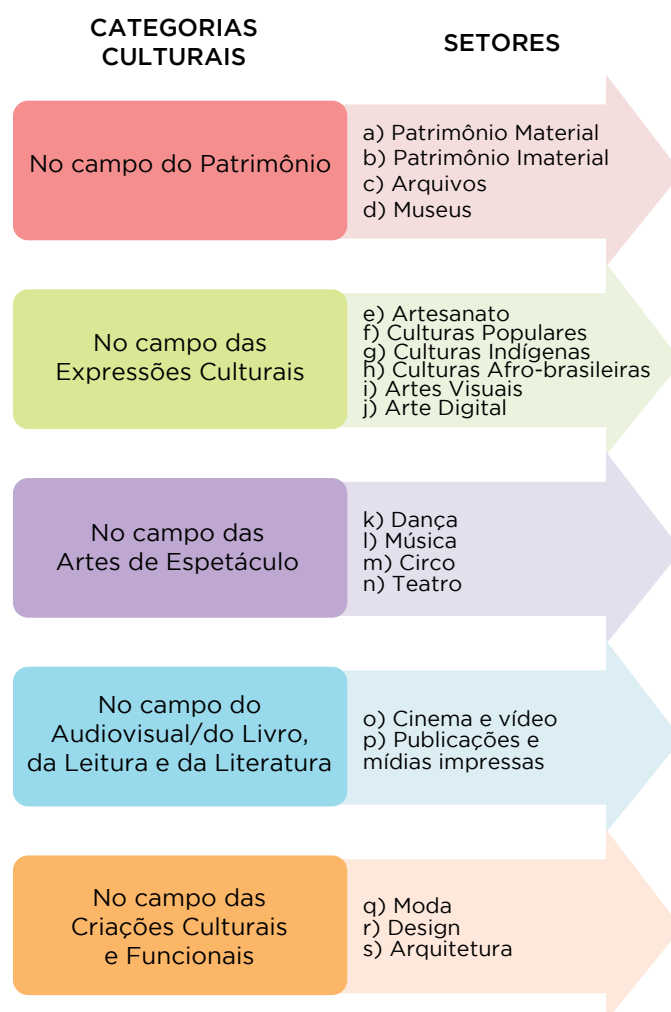
FIGURA 7: Escopo dos Setores Criativos Ministério da Cultura (2011)

Como já foi dito, até recentemente, o escopo dos setores contemplados pelas políticas públicas do MinC se restringia àqueles de natureza tipicamente cultural (patrimônio, expressões culturais, artes de espetáculo, audiovisual e livro, leitura e literatura). Recentemente esse escopo foi ampliado, contemplando também setores de base cultural, com um viés de aplicabilidade funcional (moda, design, arquitetura, artesanato). Vide na FIG. 7 logo adiante, a descrição dos setores criativos contemplados pelo Ministério da Cultura.