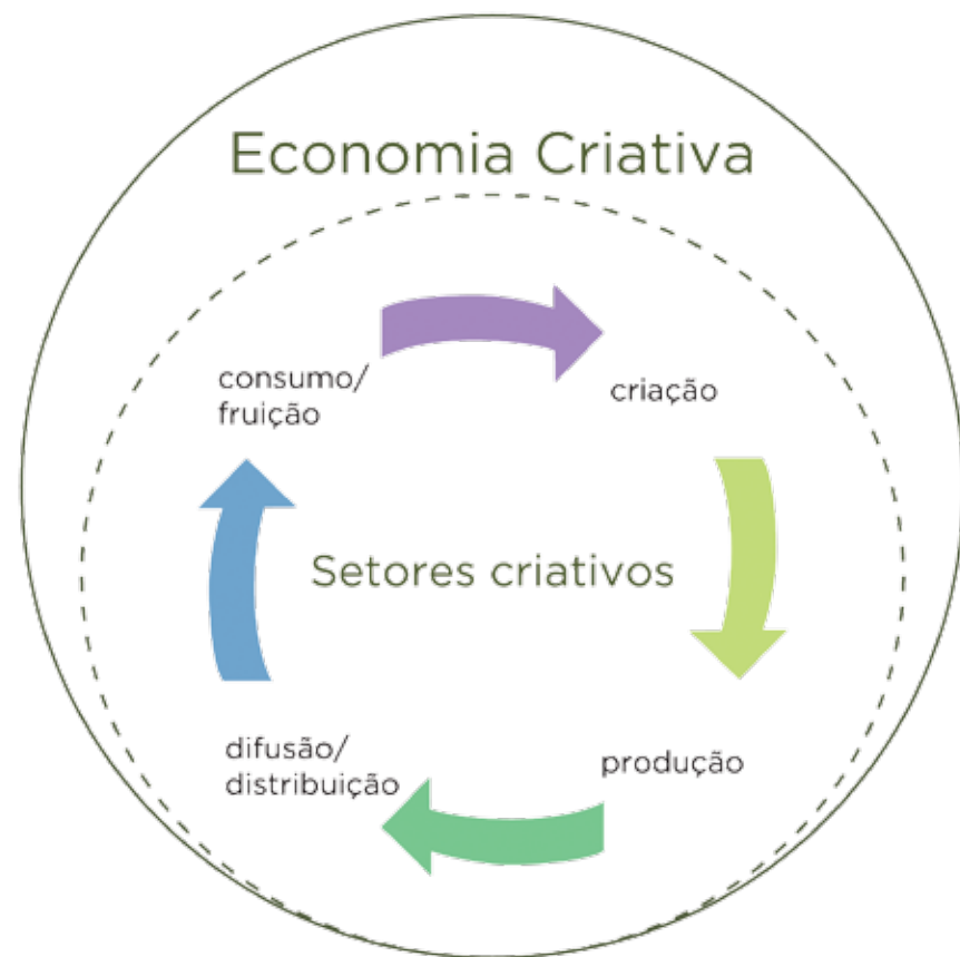
FIGURA 2: A Economia Criativa e a dinâmica de funcionamento dos seus elos

A economia criativa é, portanto, a economia do intangível, do simbólico. Ela se alimenta dos talentos criativos, que se organizam individual ou coletivamente para produzir bens e serviços criativos. Por se caracterizar pela abundância e não pela escassez, a nova economia possui dinâmica própria e, por isso, desconcerta os modelos econômicos tradicionais, pois seus novos