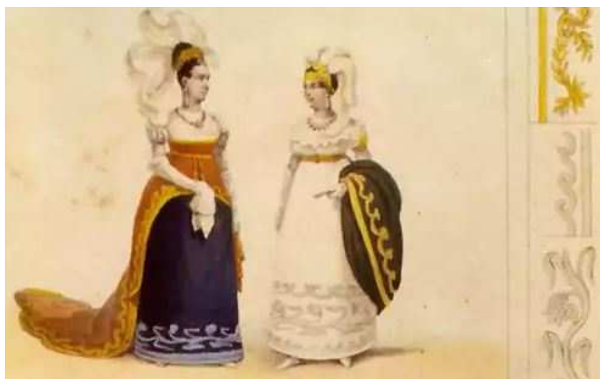
Figura 6 Duas damas da corte em grande gala (BANDEIRA, Júlio; 2013, p. 351)

estimada em um 1.660$000, confirmando a observação de Leithold sobre o valor desses ornamentos: “Sobre a cabeça colocam quatro ou cinco plumas francesas, de dois pés de comprimento, reclinadas para a frente e, sobre a fronte, como em torno do pescoço e nos braços, diademas incrustados de brilhantes e pérolas, alguns de excepcional valor” (VON LEITHOD, 1819, p. 30). Nesse conjunto, foram também consideradas as condecorações, com brilhantes, granadas e esmeraldas, da ordem militar de São Bento de Aviz, concedida tanto ao tenente-coronel, como a seu filho José Thomas.