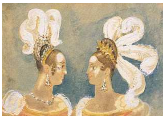
Figura 5 Damas da corte