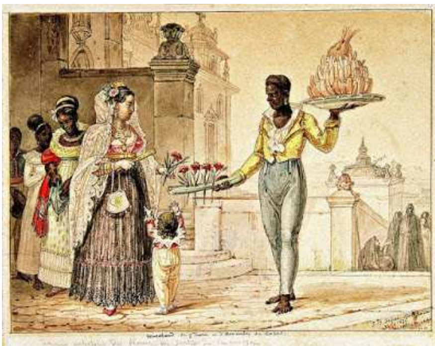
Figura 7 Vendedor de flor e fatias de coco (BANDEIRA, Júlio, 2013, p. 138)

mais ou menos uso, no valor de 30$000; “um dito de seda cor de rosa com guarnições”, no valor de 10$000; e os vestidos de “seda verde listado”, e de “dito branco de seda, com guarnições de cor”, ambos a 9$000. Havia também os complementos luxuosos, como “xale de fio de seda preta e uma guarnição de renda para vestido” avaliados em 6$000 réis, e penteador 26 de cambraia bordado, avaliado em 5$000. Para uso diário, havia onze vestidos “brancos de chita, com uso” no valor de 12$000; “cinco xales de fazendas brancas e estampadas, com uso”, no valor de 2$000; e “dois ditos de cetim verde barrados de lã e um pequeno de seda com barra amarela”. Havia também a roupa de batizado dos filhos, “três mandriões de diferentes cassas e uma touca branca” avaliada em 2$560, e “mantilha de batizar muito usada”, valendo 1$000.