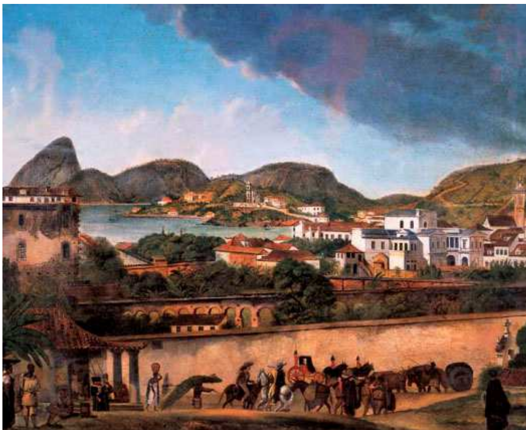
Figura 3: “A Lapa e a Igreja Nossa Senhora da Glória do Outeiro visto da rua dos Barbonos” de A. Pallière, 1821, com os fundos da casa dos Oliveira Barbosa à direita. (PESSOA, 2011, p. 168)

Os principais bens do casal eram imóveis urbanos, concentrados nos arredores do Passeio Público, possivelmente resultado de dote ou herança de Tomásia: o sobrado da rua do Passeio 16 havia sido reformado, em 1818, sob a orientação de Grandjean de Montigny, quando foi erguido um inovador hemicíclo. 19 Como também uma fronteira de pedra cal e moradas de casas térreas na rua das Marrecas 8 e 26, que somaram 49 contos e uma propriedade rural, no Catumbi Grande. 20