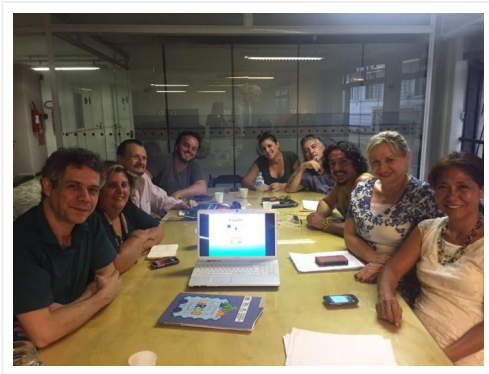
Encontro inicial com lideranças do Circo definiu as abordagens e a agenda de reuniões com as várias áreas de produção circense

Ao final desses encontros, o articulador irá formular um conjunto de propostas ao Comitê Executivo da PNA para serem incorporadas ao processo da Política Nacional das Artes.