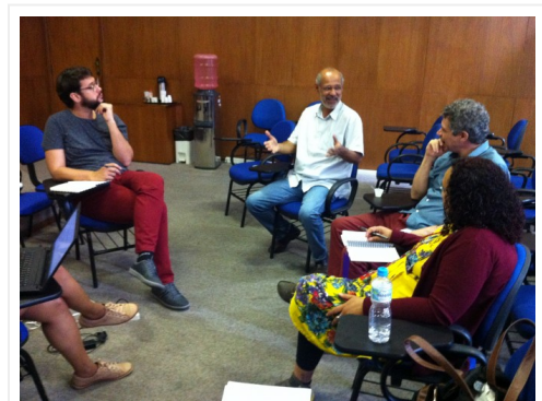
Reunião alinhou a estratégia para o início do calendário de encontros do Circo na PNA.