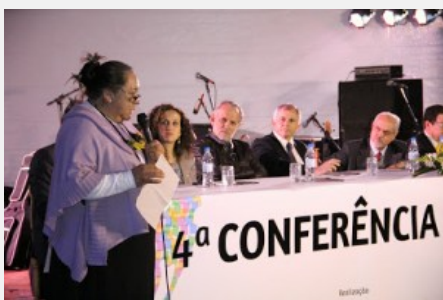
Andila, Ponto de Cultura Kahngág Järe, de Ronda Alta

Publicado em 9 de outubro de 2013 por Marcos Goulart