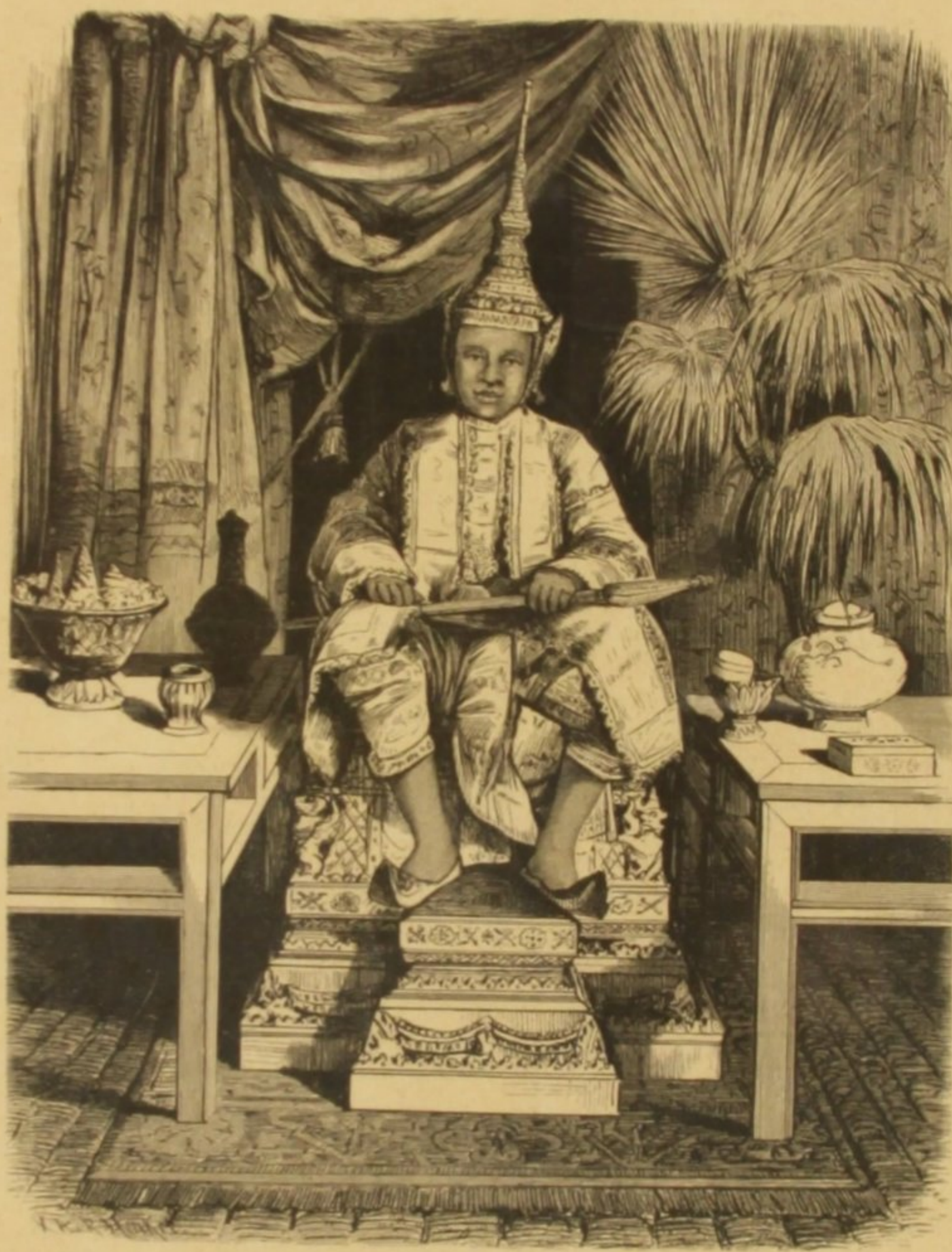
A RAINHA DE SIAM

Alliando um homem e uma mulher que tivessem temperamento nervoso, o filho nascido