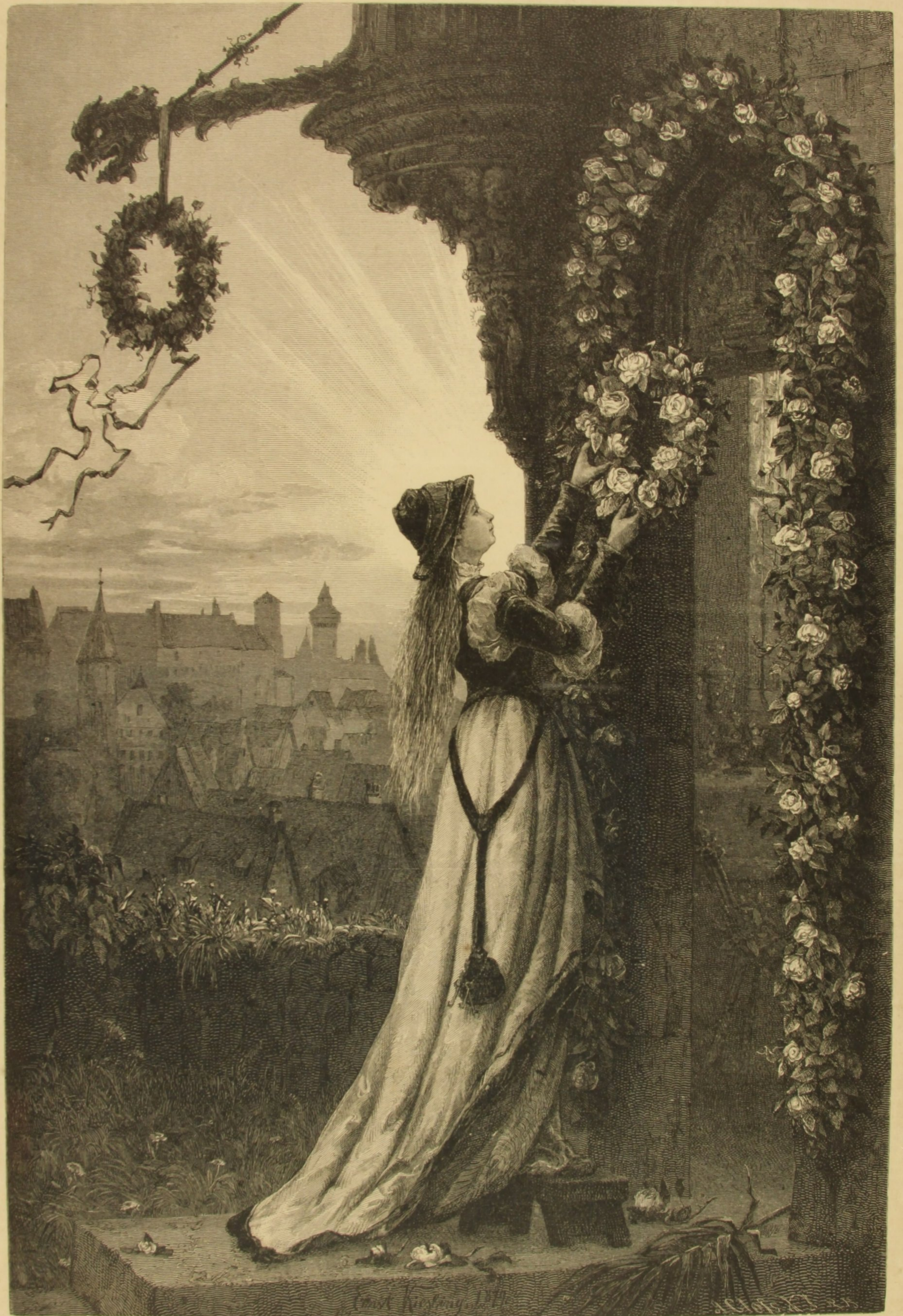
RECEPÇÃO DA NOIVA