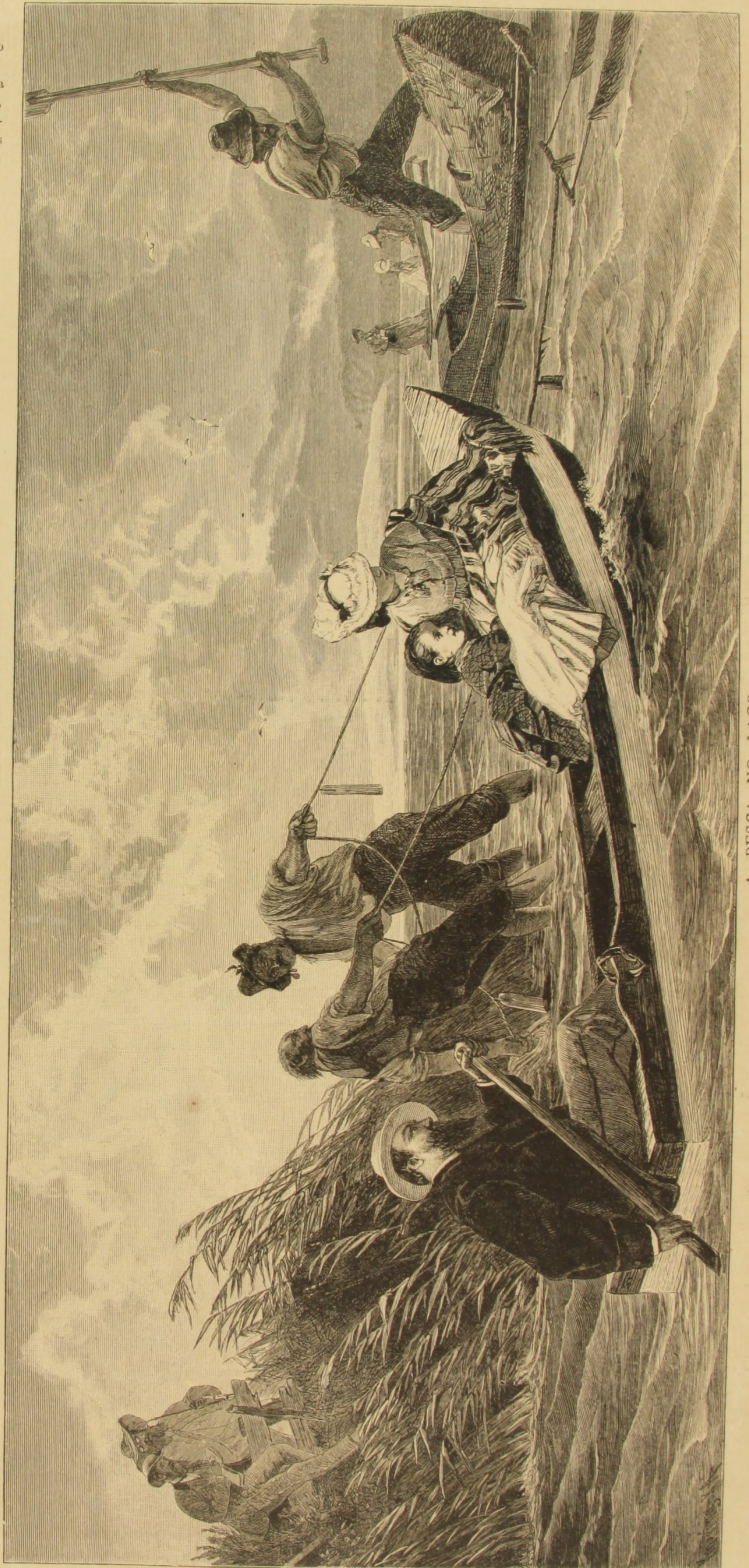
A PESCA NO LAGO