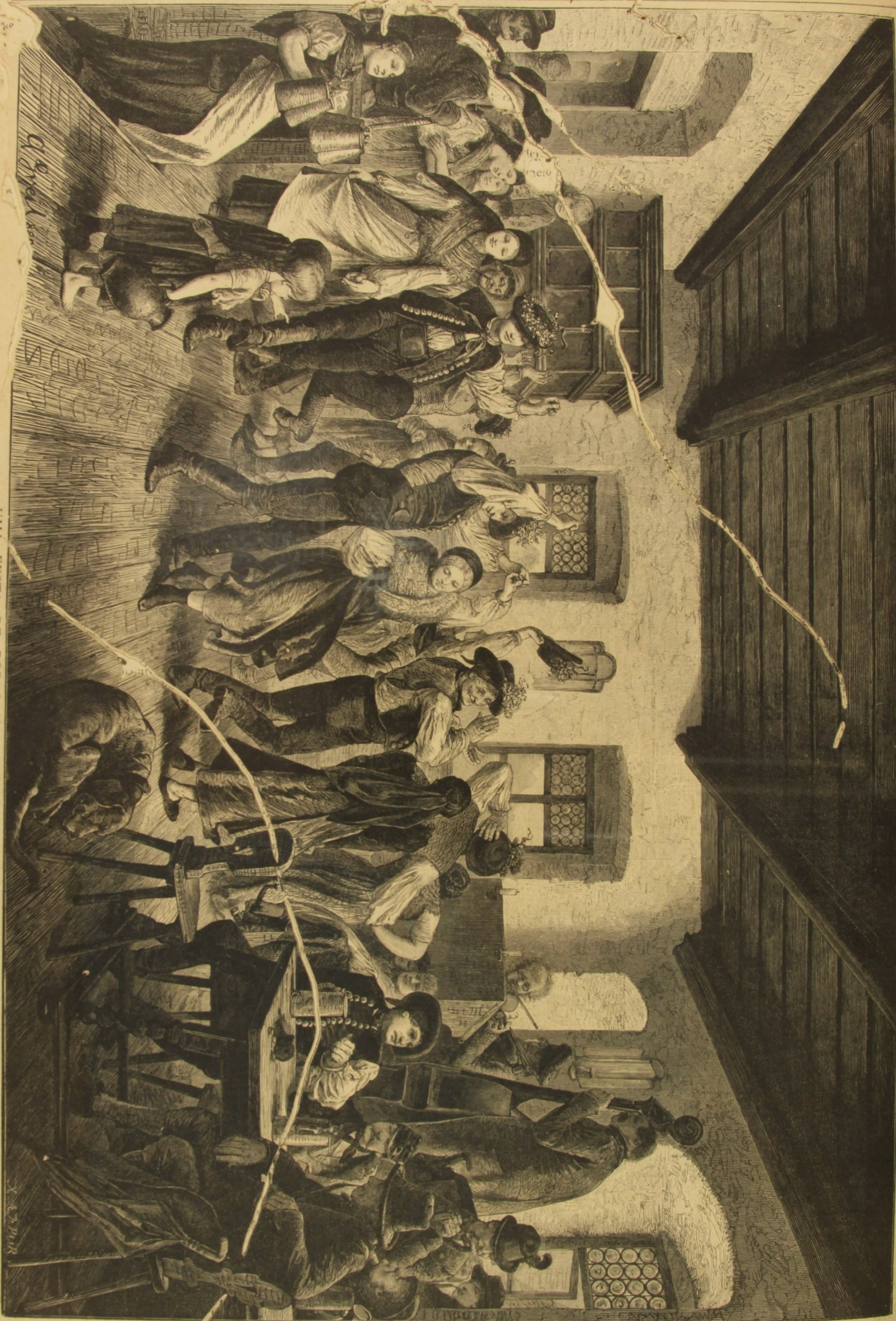
UMA FESTA DE BODAS NA AUSTRIA