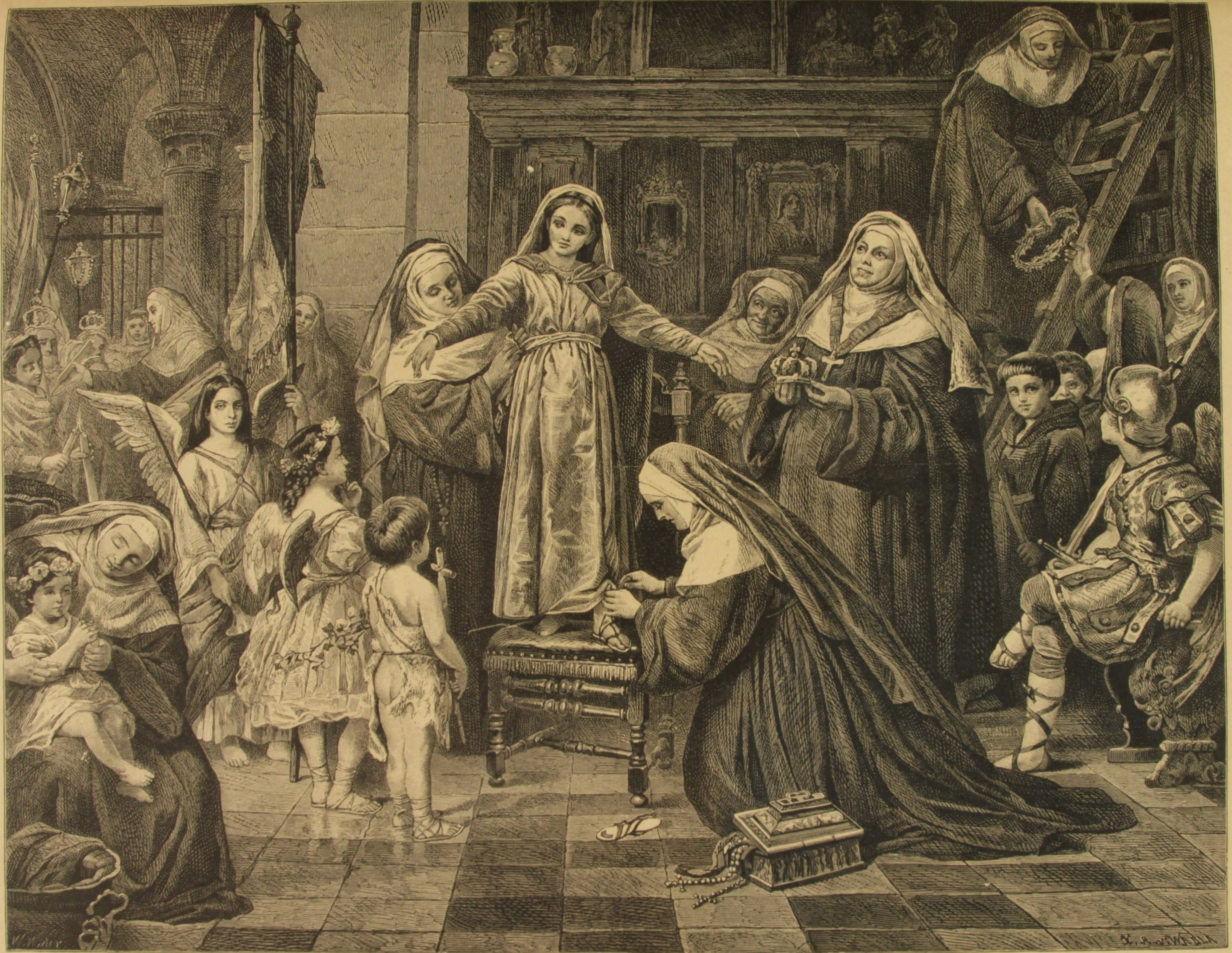
OS PREPAROS PARA A PROCISSAO DE CORPUS CHRISTI, QUADRO DE WIEDER.