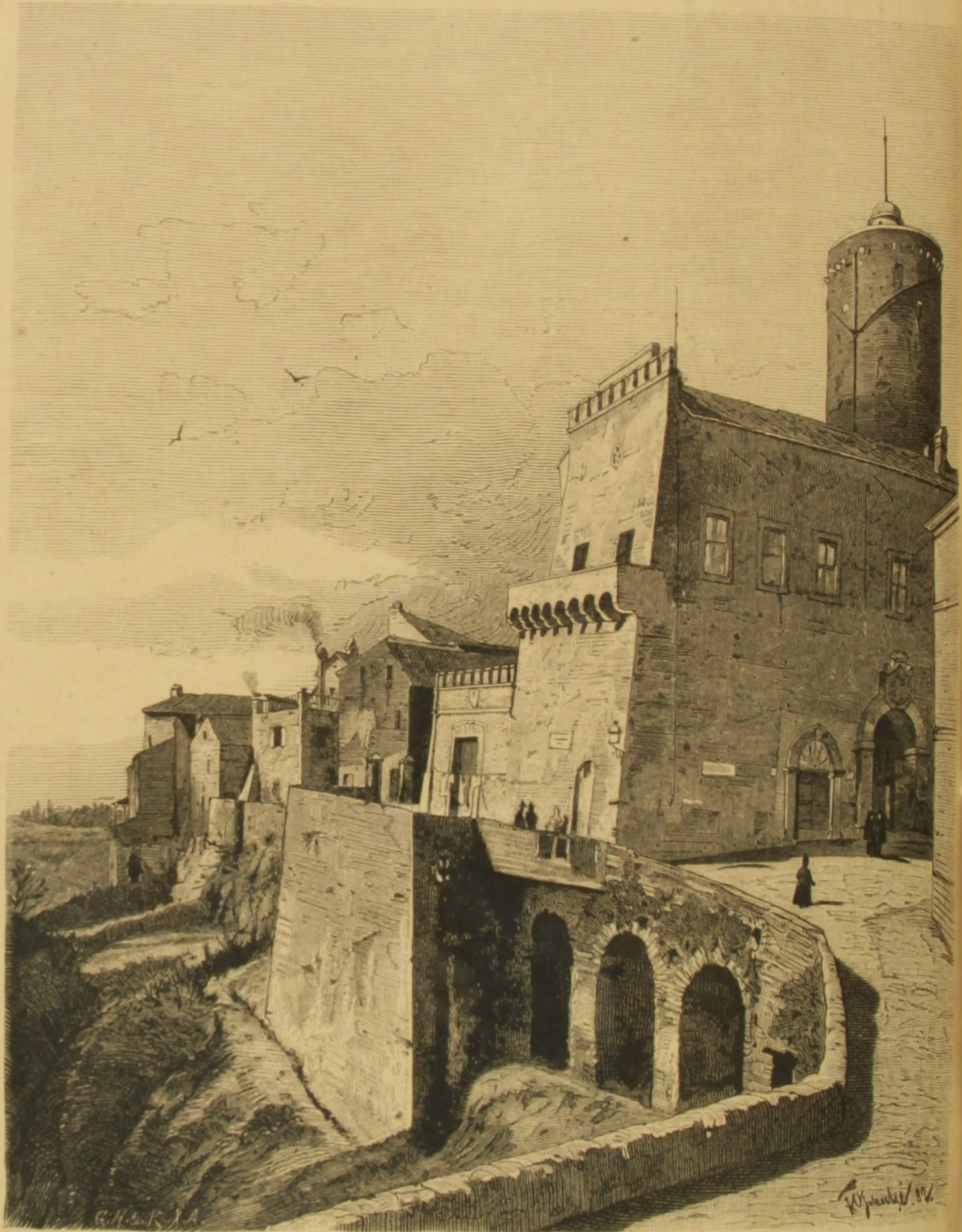
PALAZZO ORSINI EM NEMI

Ha medicos falsos que fabricam e vendem a qualquer, sem attenção nem a sexo, nem a idade, nem a temperamento do enfermo, remedios que as mais das vezes pôdem trazer consequências desastrosas. Esses charlatães são verdadeiros envenenadores.