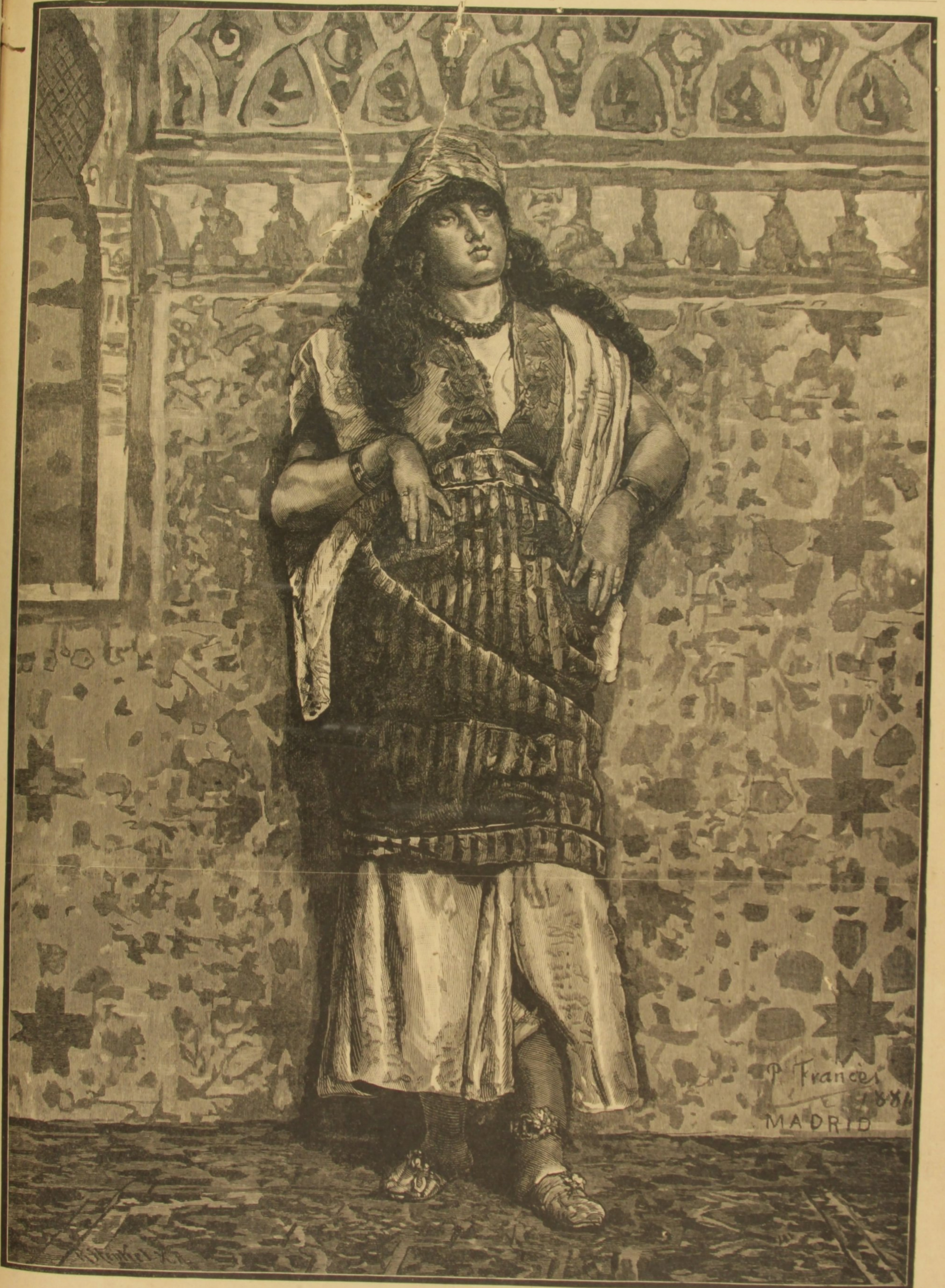
UMA MULHER ARABE