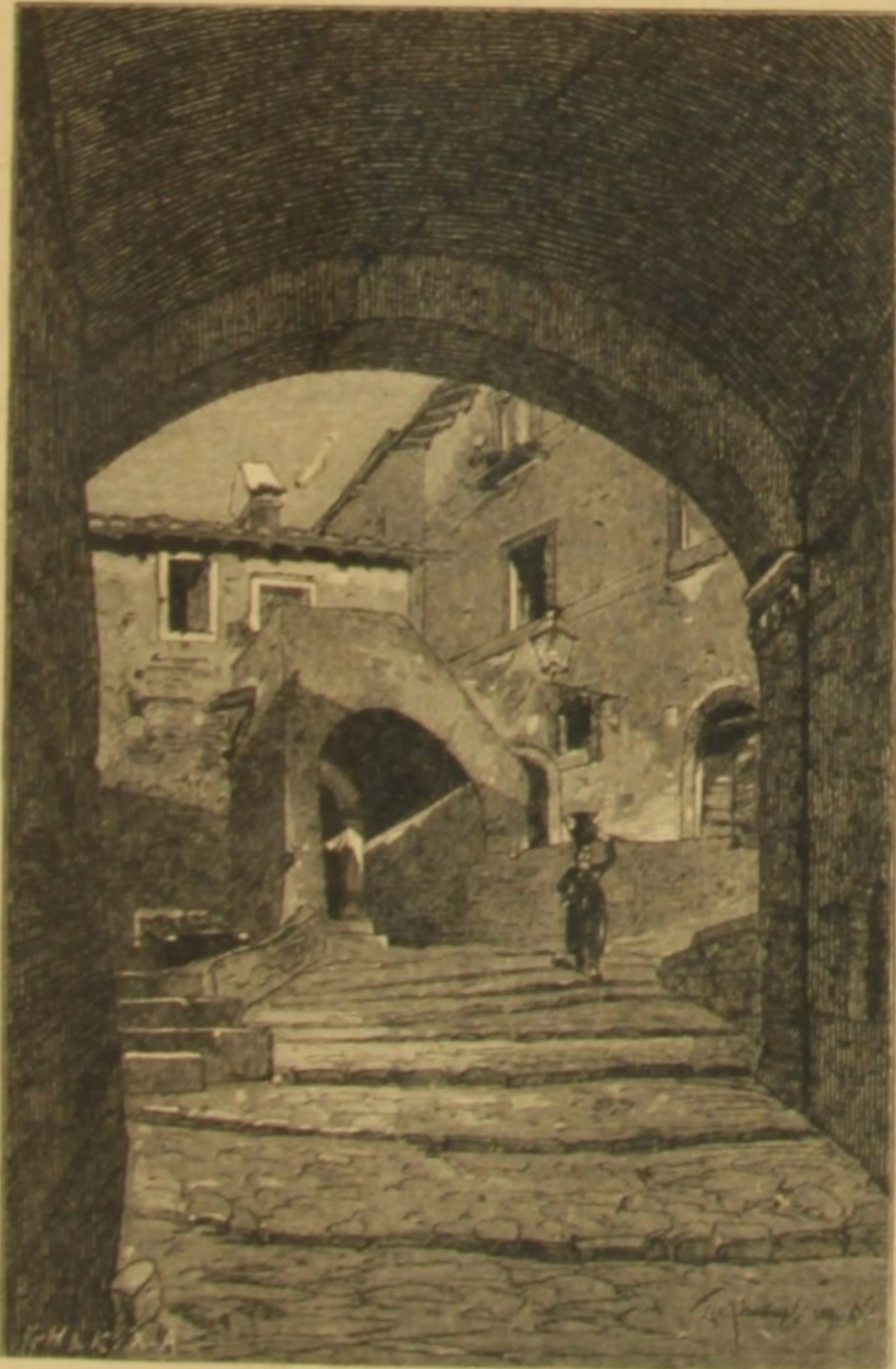
UMA RUA DE NEMI

CANCRO. — Muitas pessoas tomando ao pé da letra a expressão: roido por um cancro persuadem-se que os doentes que soffrem desta molestia têm de alimentar a ferida sob pena de ser por ella devorados. Assim é que se vê infelizes deitar-lhes todas as manhãs um pedaço de toucinho ou fresura para satisfazer ao seu appetite nunca satisfeito. E' um preconceito ridiculo este. O cancro é uma affecção cruel que decompõe e destrõe os orgãos, com as applicações de carne só se consegue aggravar-a porque esta decompondo-se contribue para a infecção da chaga.