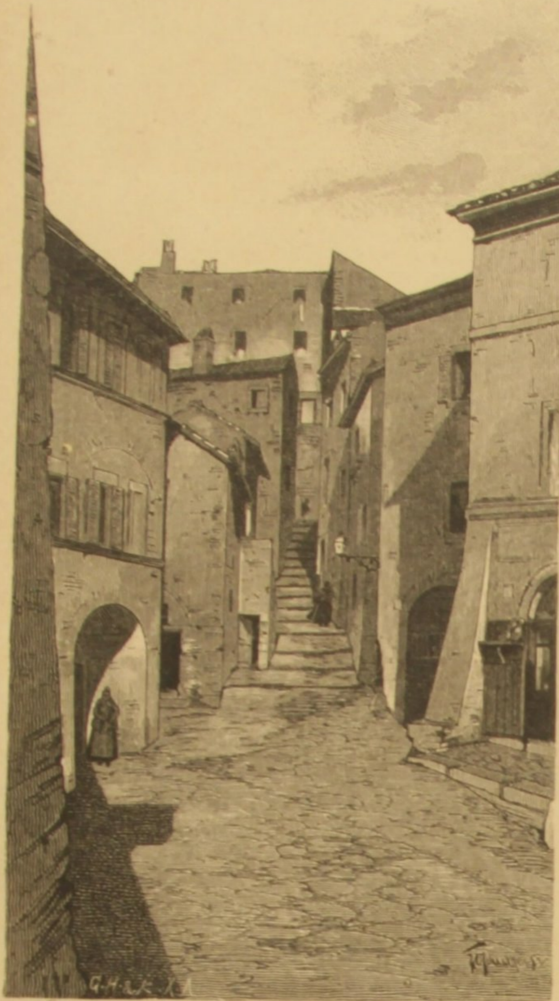
UMA RUA EM NEMI