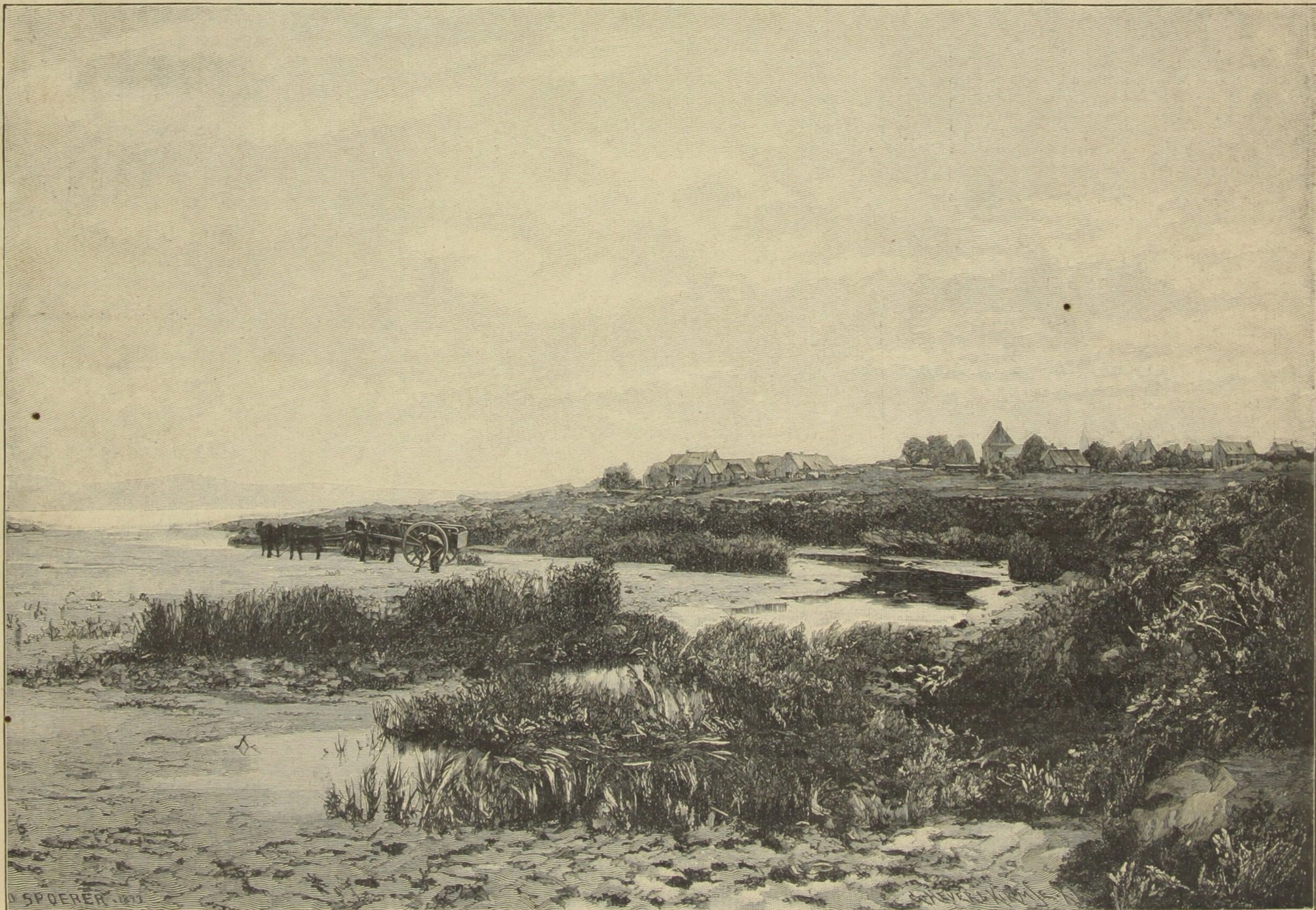
SALINA ABANDONADA NA BRETANHA

Esta bandeira foi logo içada no yamen do ex-governador, e uma quantidade enorme de bandeiras semelhantes de todas as dimensões appareceram espa-