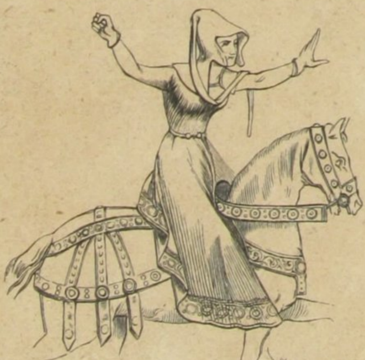
MULHER FRANCEZA A CAVALLO (XVI SEculo)