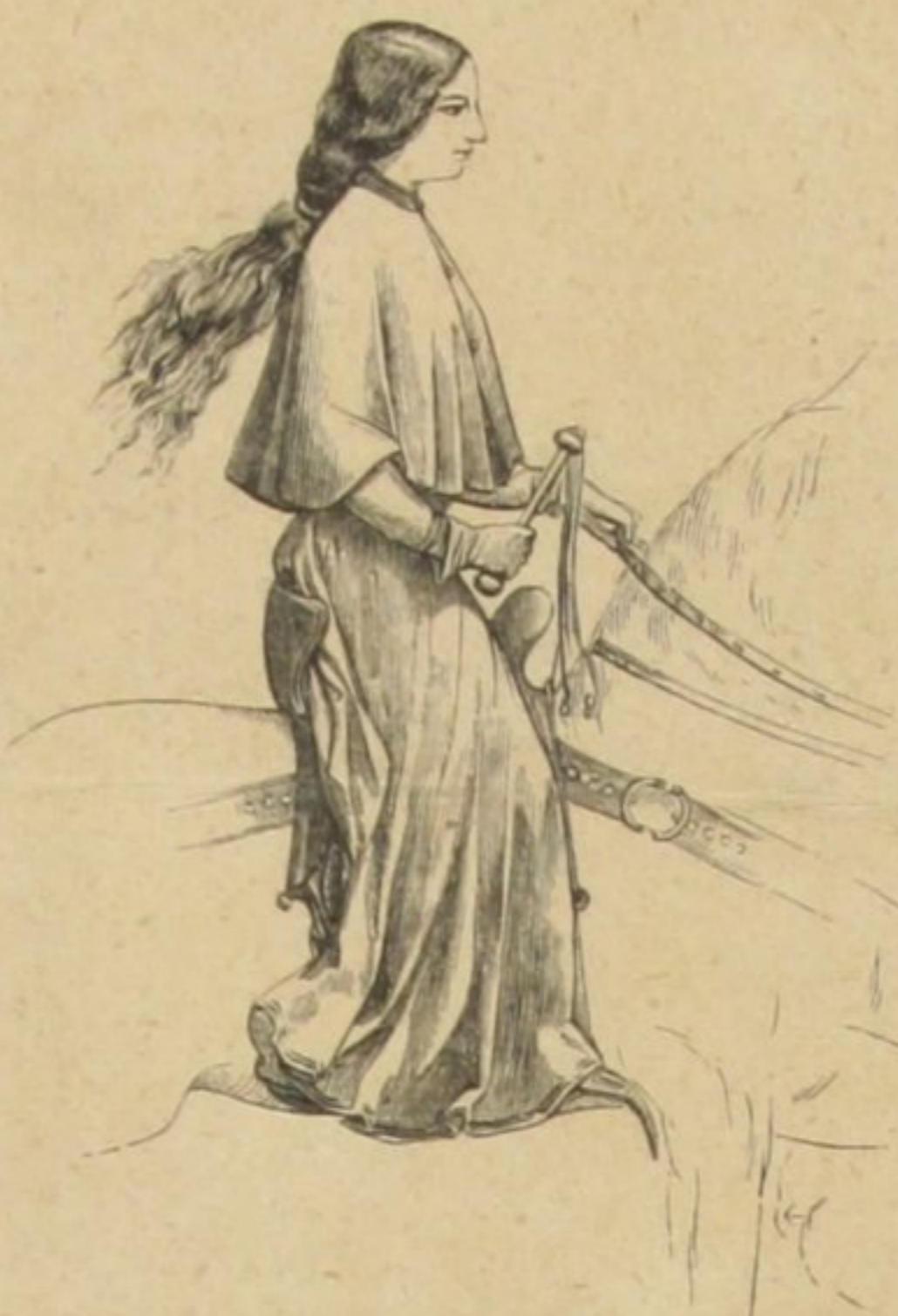
CAVALLEIRA ITALIANA (XIV SEculo)

te da sella e dos arreios com chocalhos, como o prova o enfeite do cavallo de uma amazona franceza do XIV seculo. Os homens estimulavam o animal por meio de esporas e raras vezes do chicote; as senhoras sempre se utilisavam do chicote. Mesmo no XIII seculo a montaria de lado constituia uma excepção, era uma moda fidalga que chamava a attenção. Um