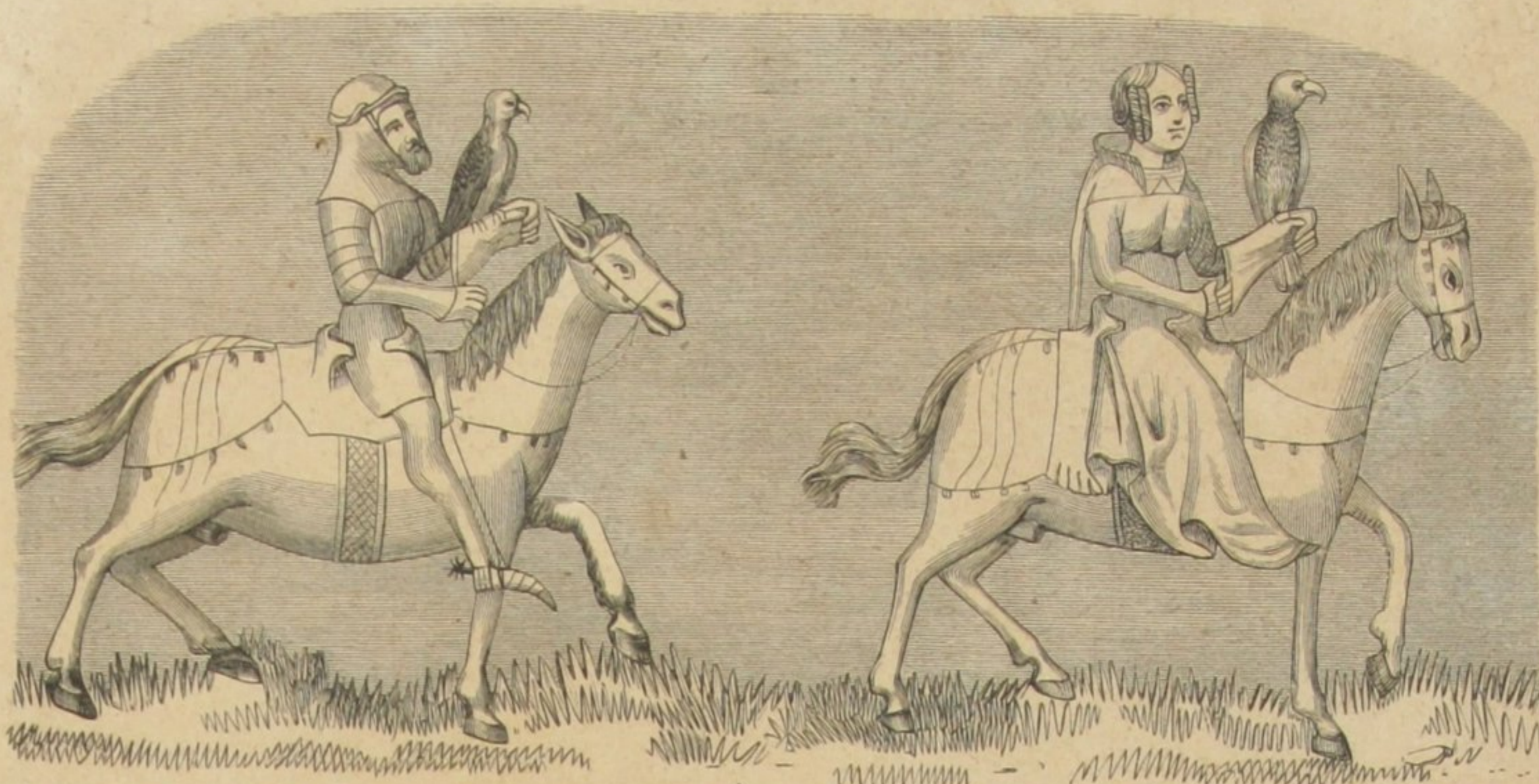
CAVALLEIRA FRANCEZA (XIV SEculo)