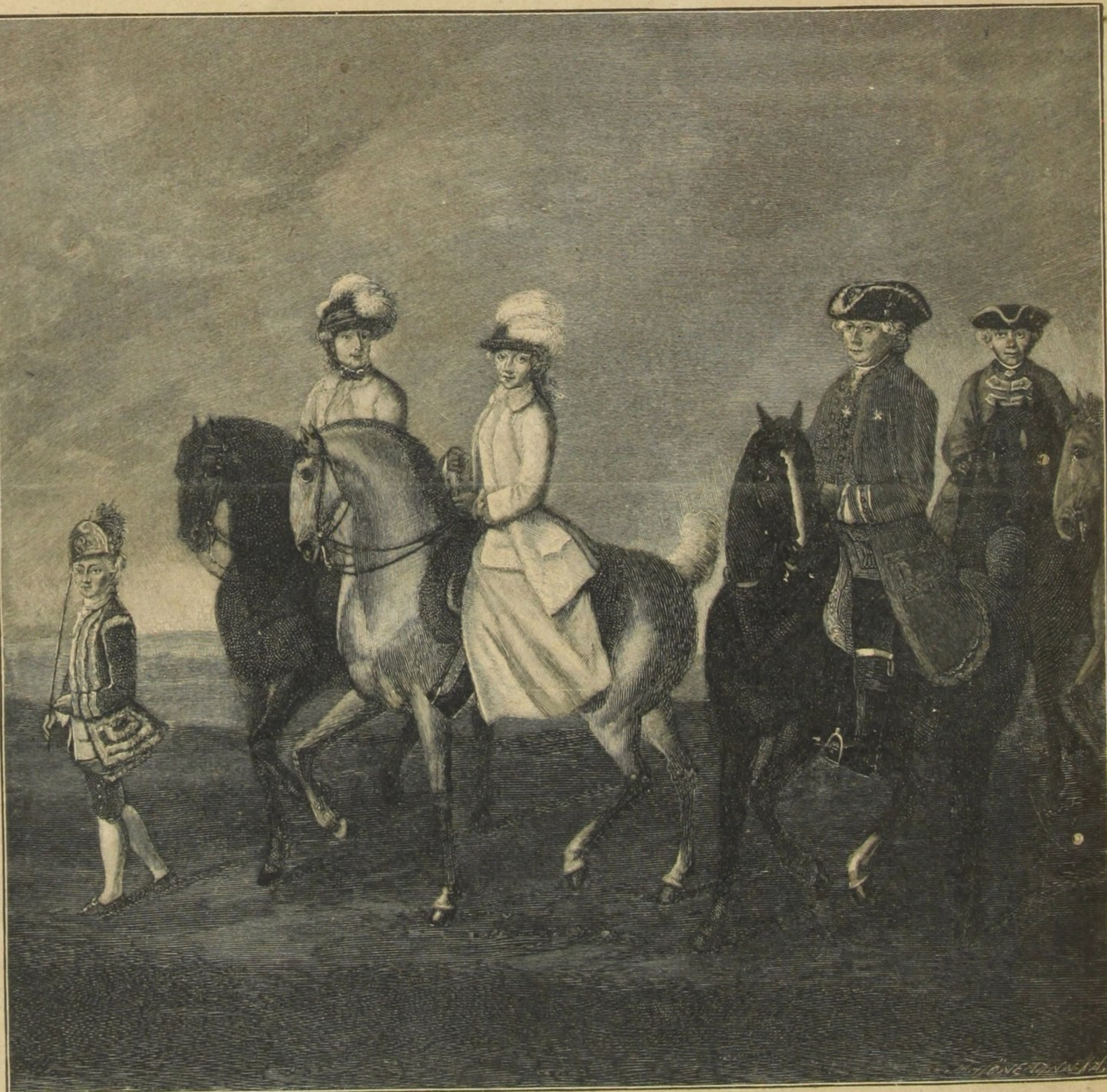
DUQUEZA ANNA AMELIA DE SAXE WERNIER

Todas estas alterações porem só tiveram logar gradualmente de modo que ainda hoje o facto das mulheres montar como os homens não desapareceu de todo. Perdurou mesmo até o seculo XVIII Especialmente nas caçadas e em expedições mais demoradas as senhoras preferiam esse modo de montar segundo a arte allemã, conforme era denominado, para distinguil-o do modo de montar de lado, isto é, da moda ingleza. Ainda a duqueza Amalia de Saxe, mãe de Carlos Augusto e amiga de Goethe montava a cavallo como homem, como mostra uma estampa exis-