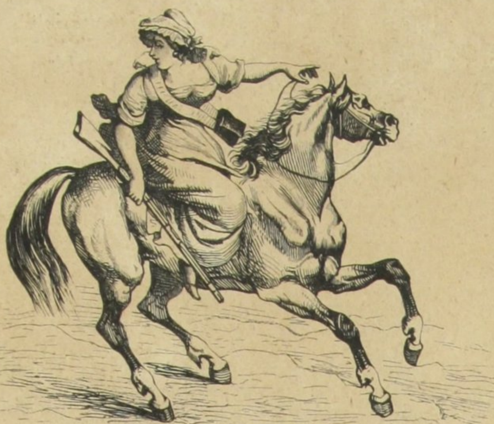
AMAZONA DO TEMPO DA REVOLUÇÃO FRANCEZA

Inſiſti com modos de incredu-lo: — Eſſa é boa! Então não ſabe d'onde vem?