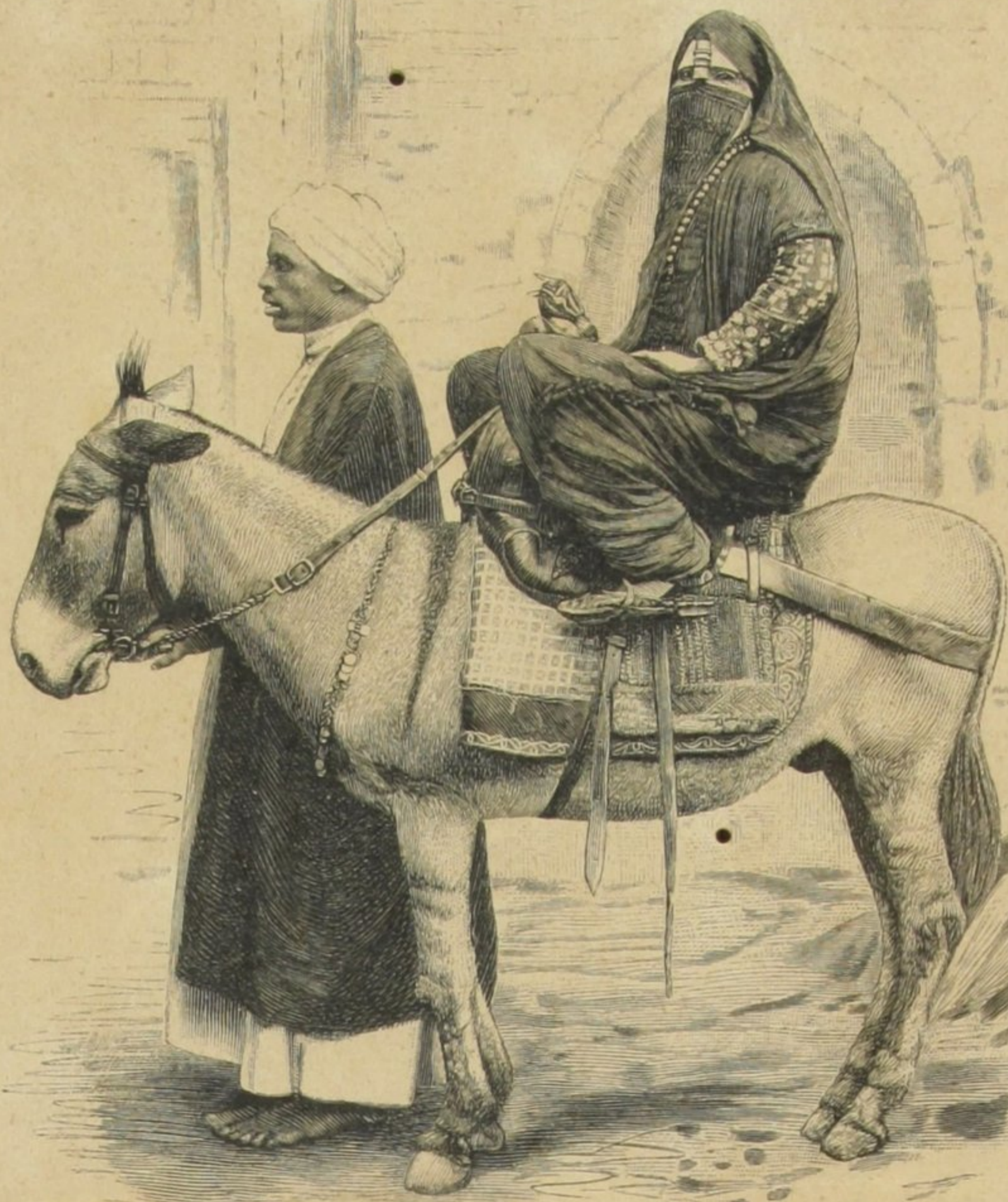
MULHER DO CAIRO A CAVALLO

guerreiro que vivamente recorda os ſeus antepaſſados.