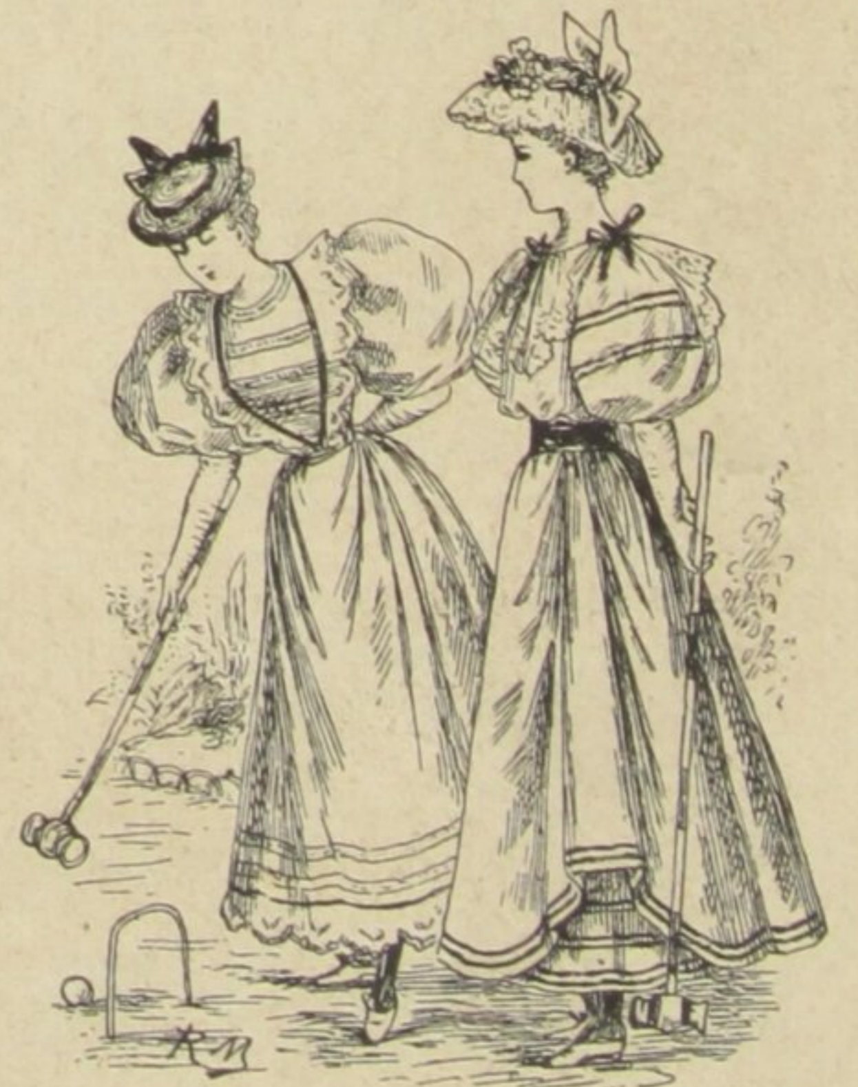
O QUE ACABA DE APPARECER