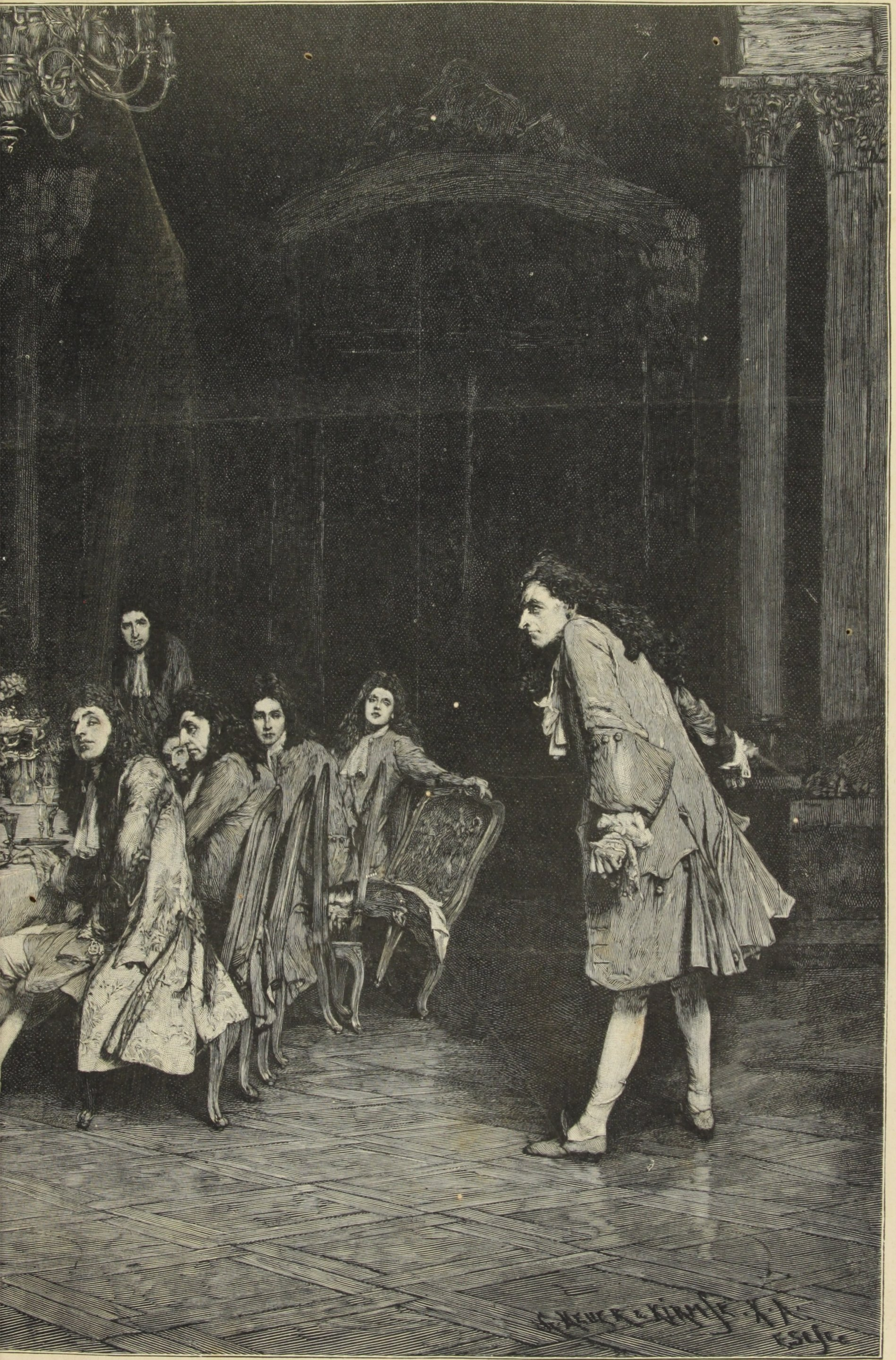
DUQUE DE SULLY