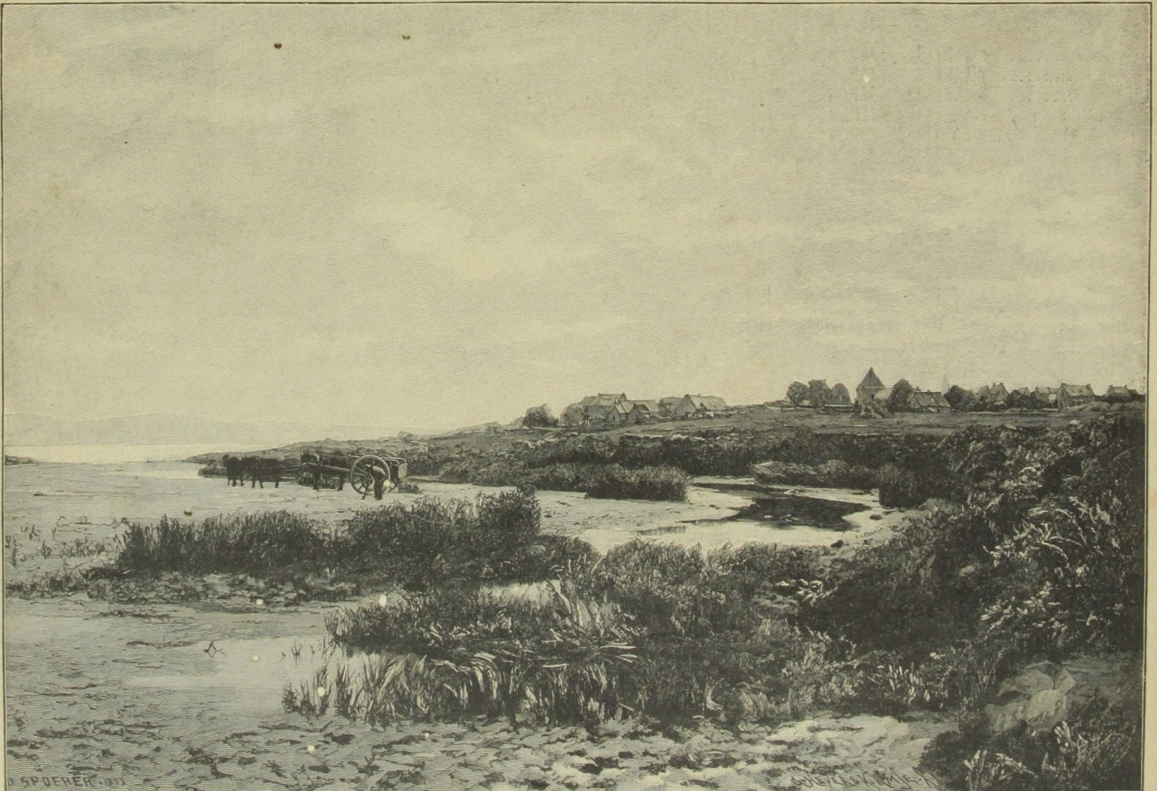
SALINA ABANDONADA NA BRETANHA

Esta bandeira foi logo içada no yamen do ex-governador, e uma quantidade enorme de bandeiras similhantes de todas as dimensões appareceram espa-