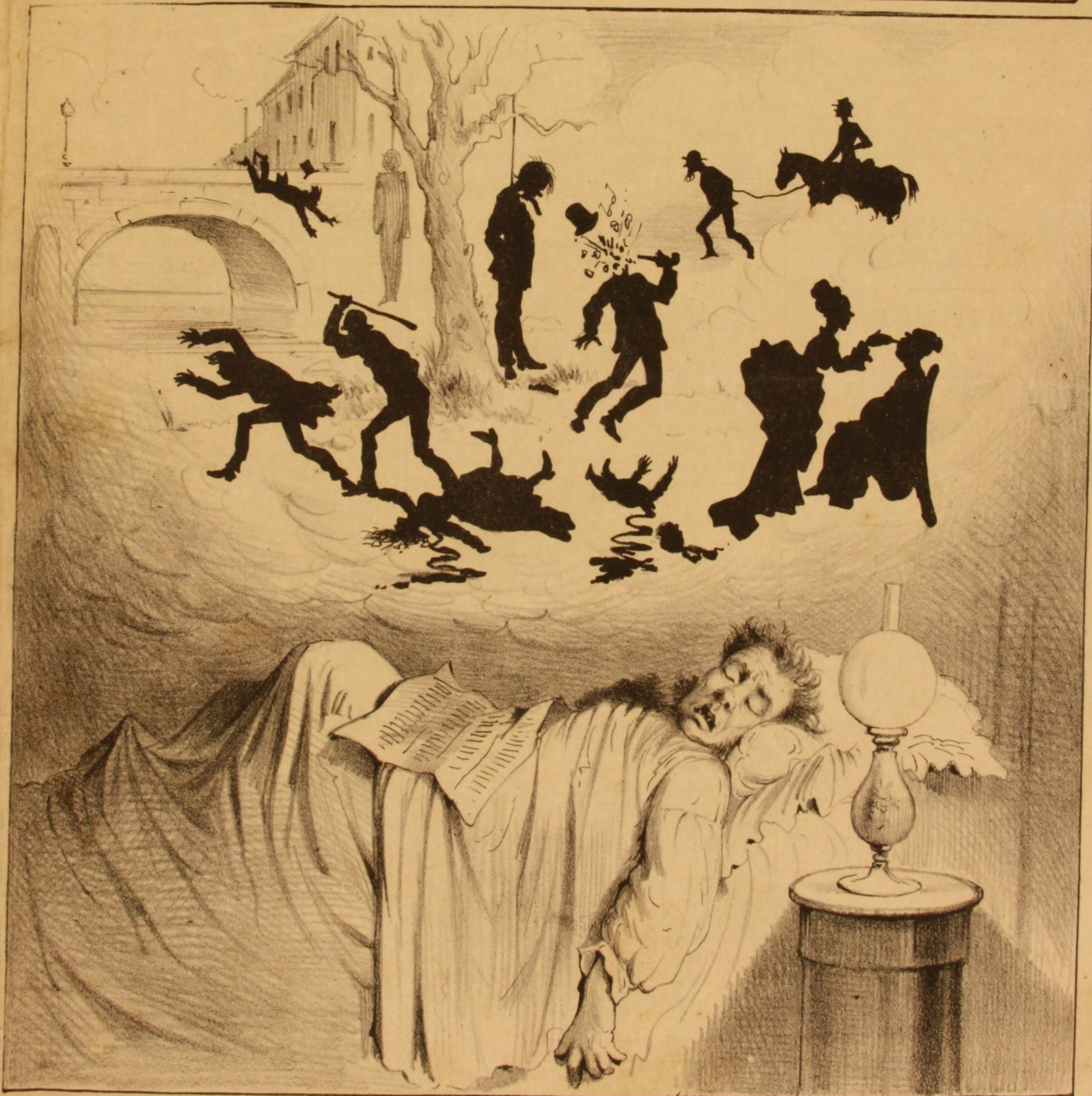
O Sr. Pantalão do Amor Virino só lê o Jornal do Commercio e Gazetilha , e acaba sempre dormindo e sonhando com mortes, suicídios, espancamentos, prisões & & &.....