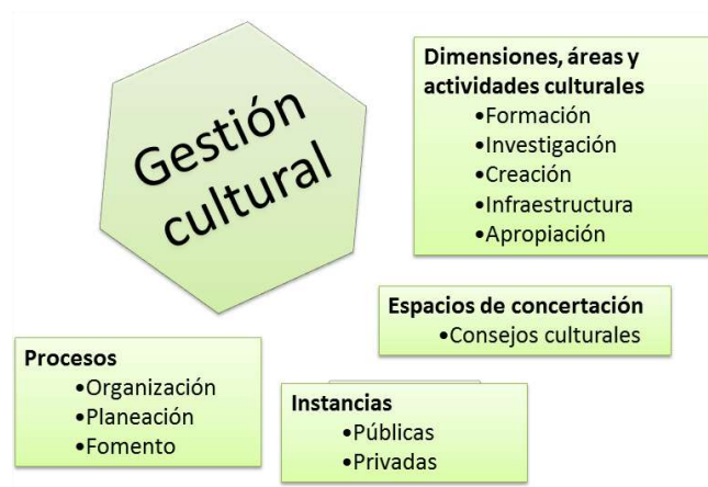
Figura 1. Aspectos de configuración de la gestión cultural. Adaptado de (ALCALDÍA DE BOGOTÁ, 2004)

Ahora se pasará a describir cada una de las subdivisiones a las que se encuentra sujeta la gestión del campo cultural y artístico, a partir de lo expuesto en las políticas culturales territoriales de la ciudad de Bogotá (ALCALDÍA DE BOGOTÁ, 2004):