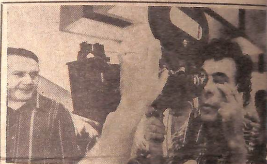
Glauber Rocha: a solidariedade da camara