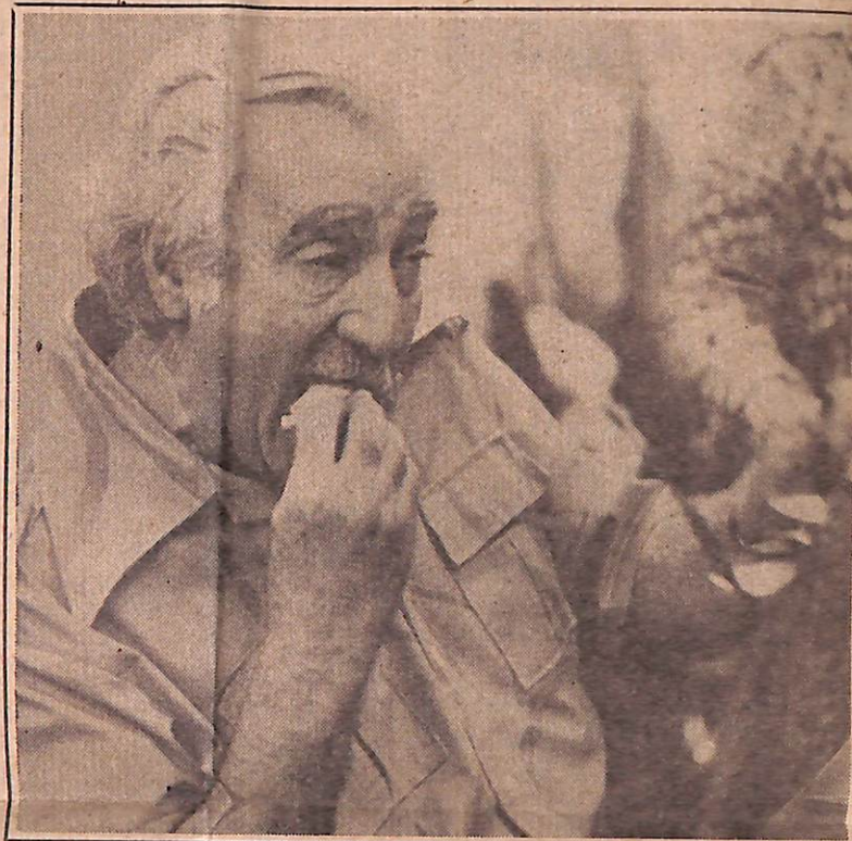
Na rápida pausa para descanso, Jorge come um sanduíche

Um fã mais exaltado comprou 14 exemplares e exigiu que Jorge autografasse todos. Glauber Rocha declarou: "Para mim Jorge Amado é tudo, é um deus". Uma mulher entrou em transe e anunciou: "Jesus Nazaré é o Salvador do mundo!" E Alfredo Machado, o editor, justificou o preço (Cr$ 160): "O livro aumentou porque o quilo da alcatra que alimenta o escritor e o editor aumentou também". As 16h 30m, exausto, com a mão latejando, Jorge Amado retirou-se; mas a venda de livros prosseguiu e naquela altura já tinha atingido a casa dos mil exemplares.