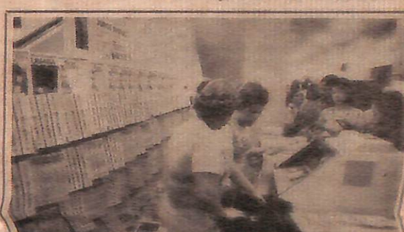
As vendedoras no incessante trabalho, nas caixas registradoras

O início da festa estava marcado para 11 da manhã, mas uma hora antes extensa fila contornava os balcões de livros, bolsas e sacos de plásticos. As vendedoras, usando camisetas cor de laranja com o título do livro impresso no peito e um botão com a frase Leve Tieta para casa , mostravam-se infatigáveis na intensa atividade de atender os compradores. Quando Jorge chegou, começou o caos. O pequeno espaço reservado para ele e sua mulher Zélia, cercado por correntes e um biombo, foi imediatamente invadido por fotógrafos comerciais, que insistiam em bater chapas dos leitores ao lado do autor pela módica quantia de Cr$ 100 a unidade. Entre empurrões, pedidos de cooperação, alguns gritos de admiração e abraços calorosos, especialmente entre os numerosos representantes da colônia baiana, a festa começou. O primeiro autógrafo foi para Raul Bopp, velho amigo e companheiro de casa de Jorge, quando ambos moraram no Rio, na Rua Barão da Torre.