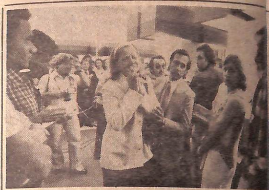
Uma mulher foi ao choro e ao transe: emocionada