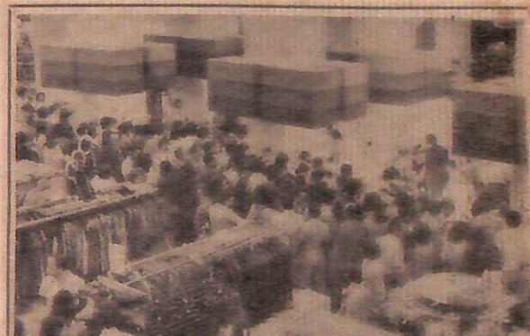
A multidão invadiu a loja e cercou o escritor