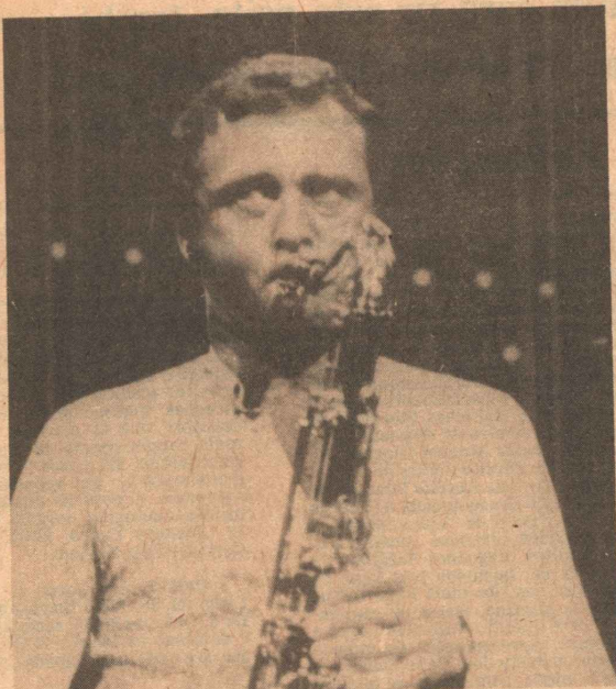
O saxtenor, divulgador da bossa nova, fará 4 shows no Rio.