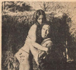
Cena das mais lindas do filme "O Caçador de Esmeraldas".