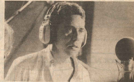
Chico no cinema

A primeira delas é "Pixote, a Lei do Mais Fraco", dirigido por Hector Babenco, tendo Marília Pera e Jardel Filho nos papéis principais. Baseado no livro "Infância dos Mortos", o filme representa o drama do menor abandonado e vem sendo esperado com alguma expectativa pela