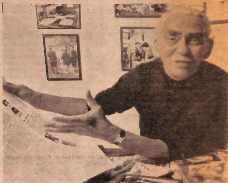
A modernização da imprensa brasileira começou com Samuel Wainer

Devem-se a Samuel Wainer importantes coberturas jornalísticas sobre a Segunda Guerra Mundial, criação de