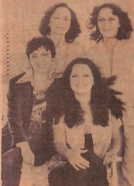
O grupo fica até domingo no Auditório Augusta.