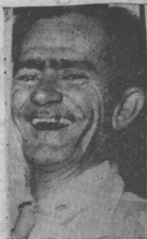
Rodolfo Coelho Cavalcante

O decano dos trovadores populares na Bahia