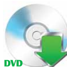
DVD A Conferência 1. Documentos de Referência 2. Regimento Interno

O SNIIC terá como objetivos principais o mapeamento, a organização e a divulgação das atividades culturais brasileiras, incluindo informações sobre estrutura (artistas, equipamentos culturais, grupos, eventos), gestão (órgãos públicos, conselhos, fundos, legislações, orçamentos e editais), financiamento, economia da cultura, patrimônio material e imaterial, entre outras. Serão destacadas, prioritariamente, as informações sobre artes cênicas, artes visuais, audiovisual, música, literatura e cultura popular. A adesão dos órgãos estaduais e municipais de cultura, bem como dos possíveis parceiros privados e não governamentais, ocorrerá paulatinamente, durante o processo de desenvolvimento e implantação do SNIIC.