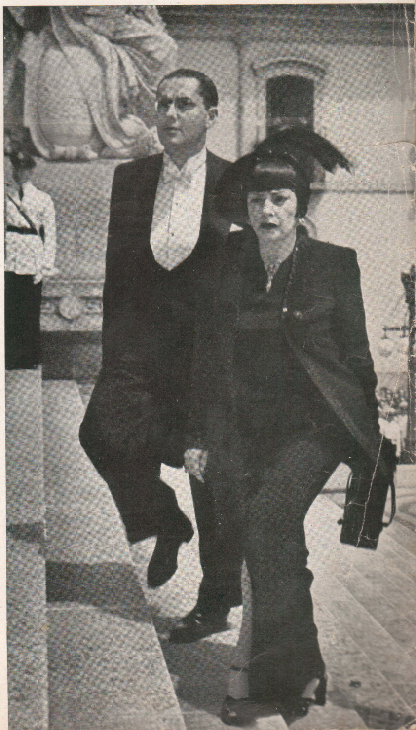
Os representantes do Partido Comunista do Brasil