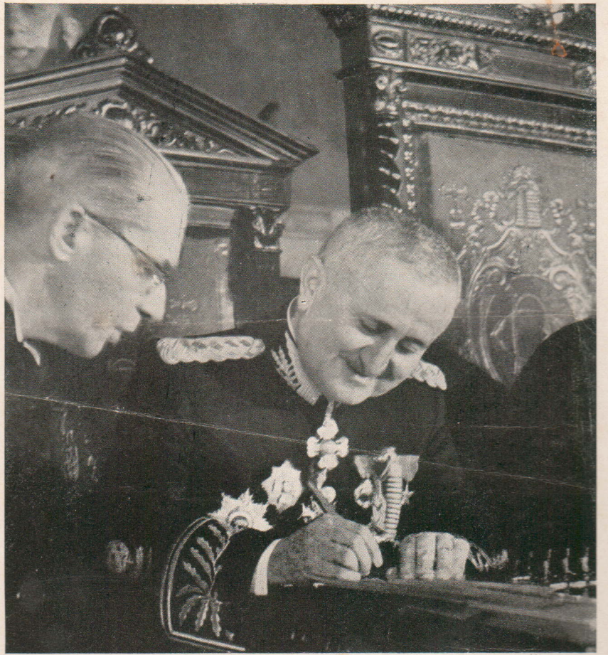
O general Eurico Gaspar Dutra assina o termo de posse