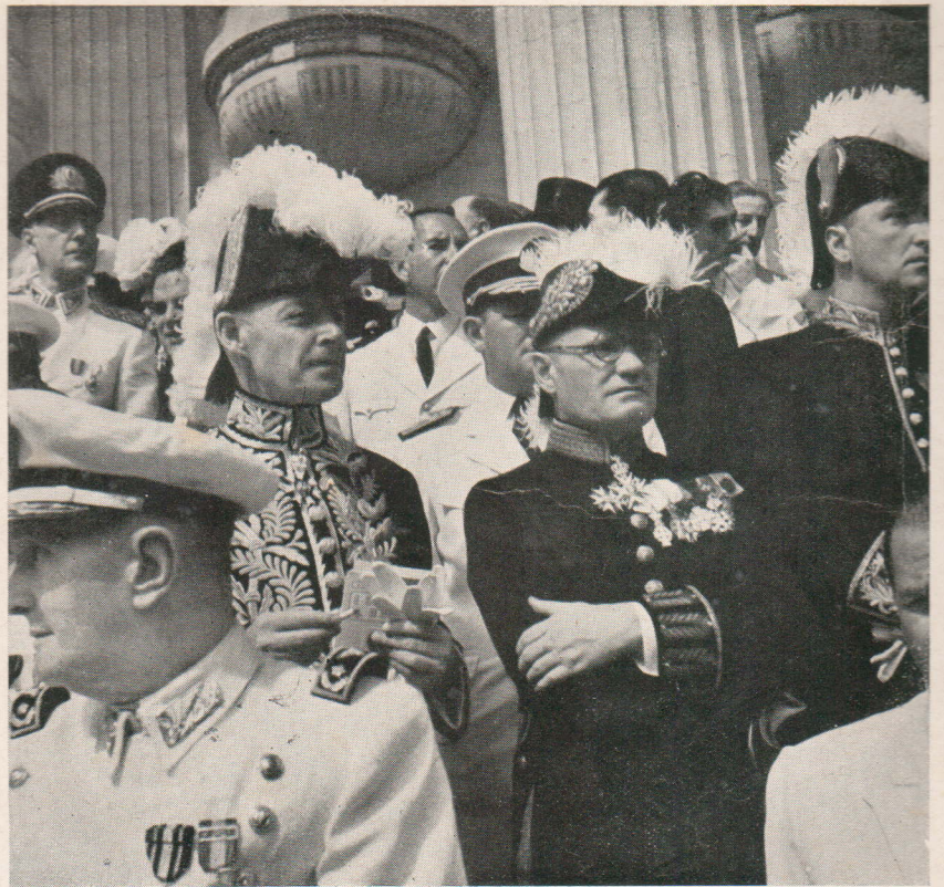
A saída da cerimônia vêm-se membros das missões estrangeiras