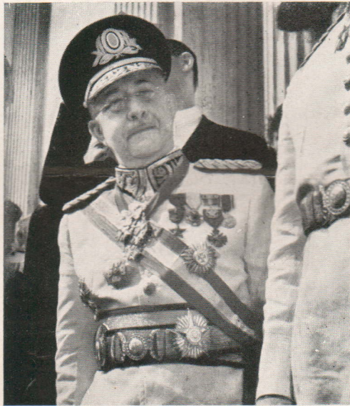
O General Mascarenhas de Moraes