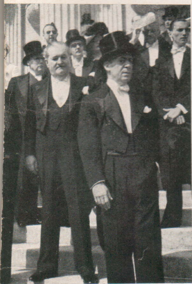
O Corpo Diplomático