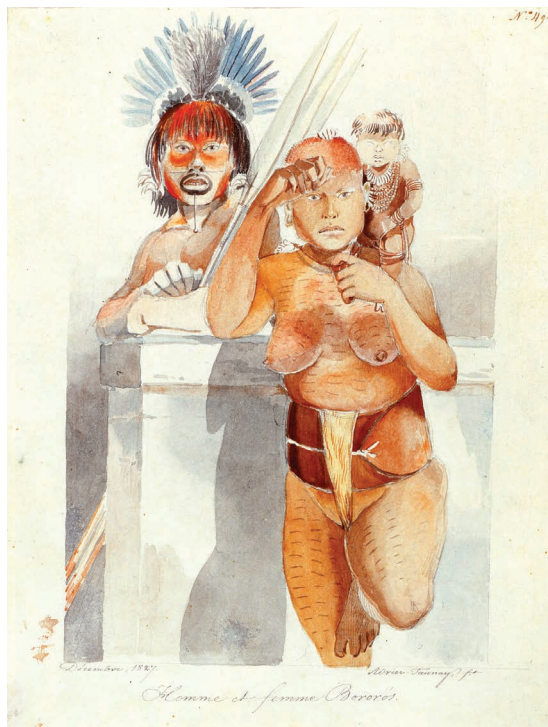
FIGURA 2. Homem e mulher Bororo , Aimé-Adrien Taunay, 1827. Lápis e aquarela sobre papel. Acervo da Academia das Ciências de São Petersburgo.