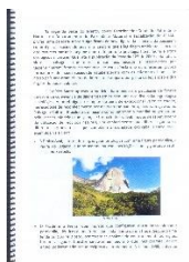
Exemplo da página de um arquivo digitalizado

No próximo período, o projeto deverá dar continuidade à alimentação da base de dados, com a pesquisa e reprodução de documentos na Fundação Jardim Botânico, no Arquivo do Iphan e outros órgãos estaduais e municipais citados no curriculum.