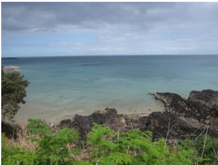
FIGURA 2 - VISTA DA ILHA ROCHOSA DE JERSEY, SITUADA NO CANAL DA MANCHA, DE FRENTE PARA A FRANÇA.