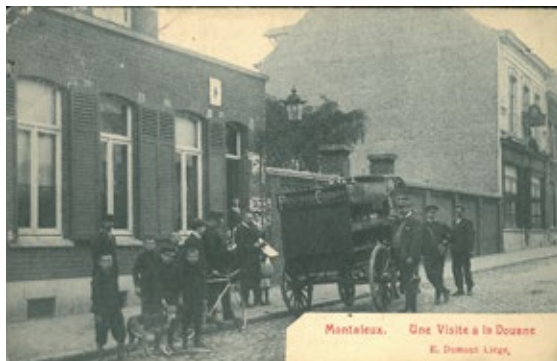
FIGURA 7 - CARTÃO-POSTAL MOSTRANDO UM CONTROLE ADUANEIRO NO POSTO DA FRONTEIRA DE MONTALEUX, LITERALMENTE “O MONTE DOS LOBOS”.