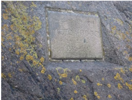
FIGURA 4 - O ROCHEDO DOS EXPATRIADOS E A PLACA ALUSIVA À PRESENÇA DE VICTOR HUGO EM SAINT-HÉLIER, COLOCADA NO TOPO DE UM BLOCO DE PEDRA, PARA IMORTALIZAR SUA ESTADA NA ILHA.