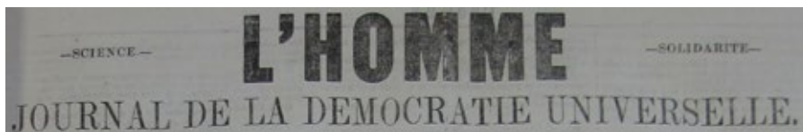
FIGURA 1 - ANÚNCIO DO JORNAL REPUBLICANO L'HOMME .