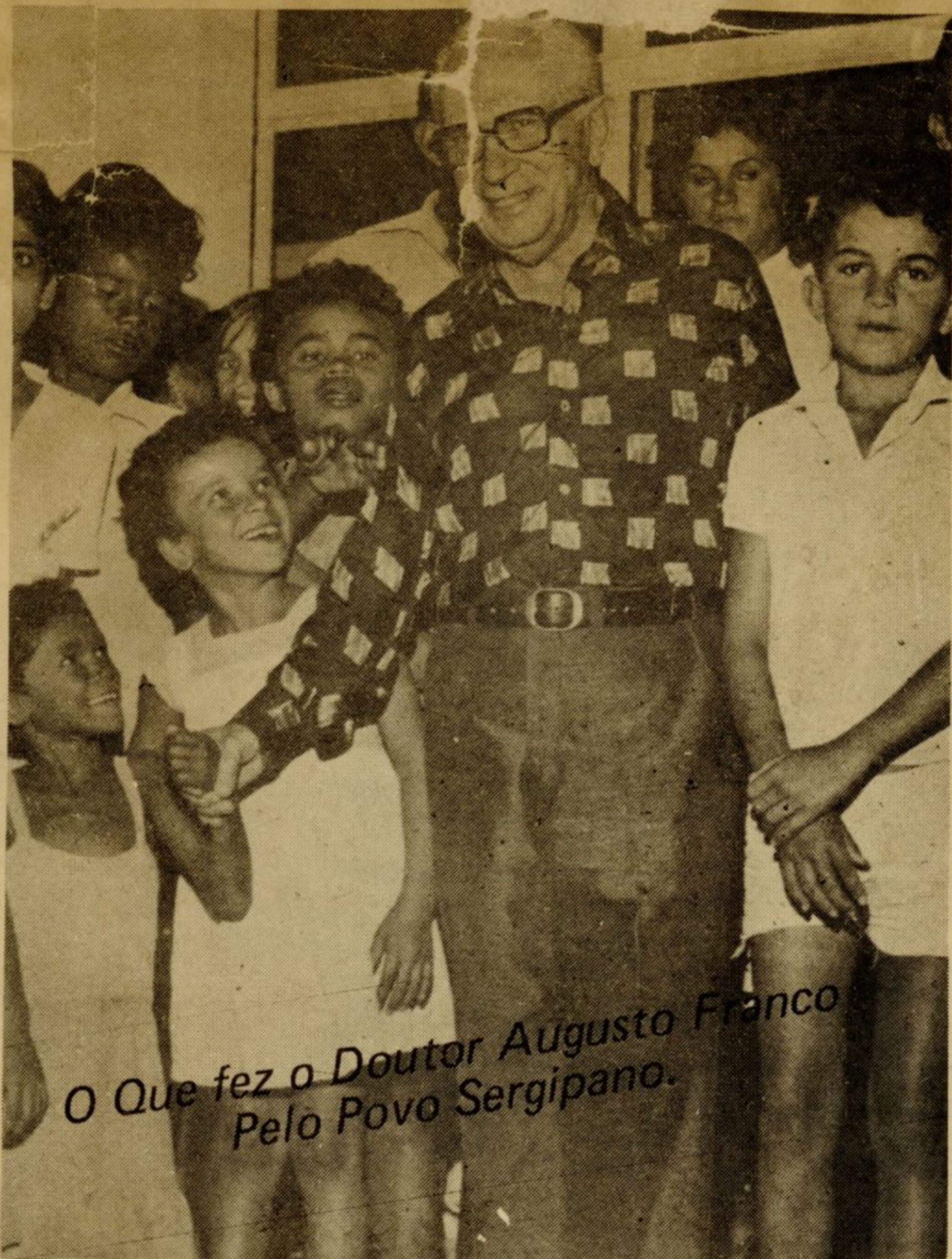
O Que fez o Doutor Augusto Franco Pelo Povo Sergipano.