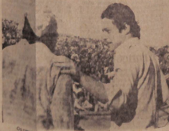
Os caros amigos: Chico Buarque foi a Três Pontas, cantou e dançou