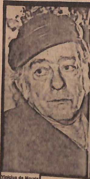
VINÍCIUS DE MORAES