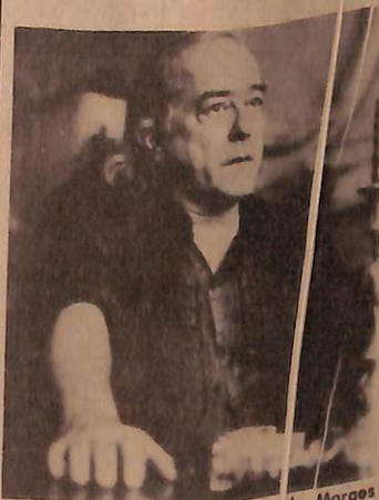
Vinícius de Moraes

Em Fortaleza, no Ceará, os estudantes, intelectuais e a gente fina do lugar espera por Vinícius de Moraes . Sem Toquinho, ele vai fazer uma palestra no Teatro José de Alencar. Os divulgadores informam que, durante a conferência, o tema será a evolução da poesia brasileira nos últimos vinte anos. Antes e depois, poderá variar, e as preferências se concentram em uísque e mulheres.