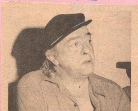
Vinicius de Moraes na estréia do "É Hora de Brasil: MPB Show", hoje, pela TV Gazeta.