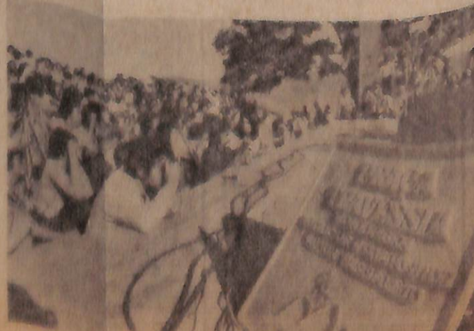
A imprensa nacional esteve presente ao show-homenagem de Milton

esqueceu todas as letras e arranhos; quem não esqueceria, se pousado no centro de uma paisagem deslumbrante, sob os olhares amigos de 10, 15 mil convidados que vieram de todos os cantos do Brasil para integrar o ato de amor entre um artista de gênio e o povo de sua pequena cidade?