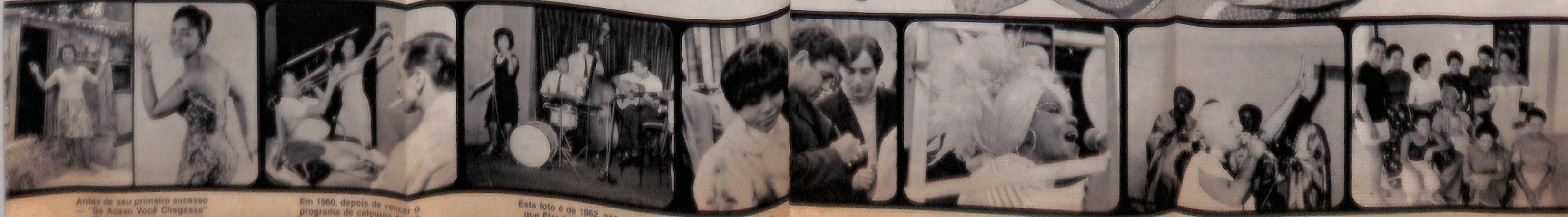
Antes de seu primeiro sucesso — "Se Acaso Você Chegasse" — Elza Soares morava numa taverna.