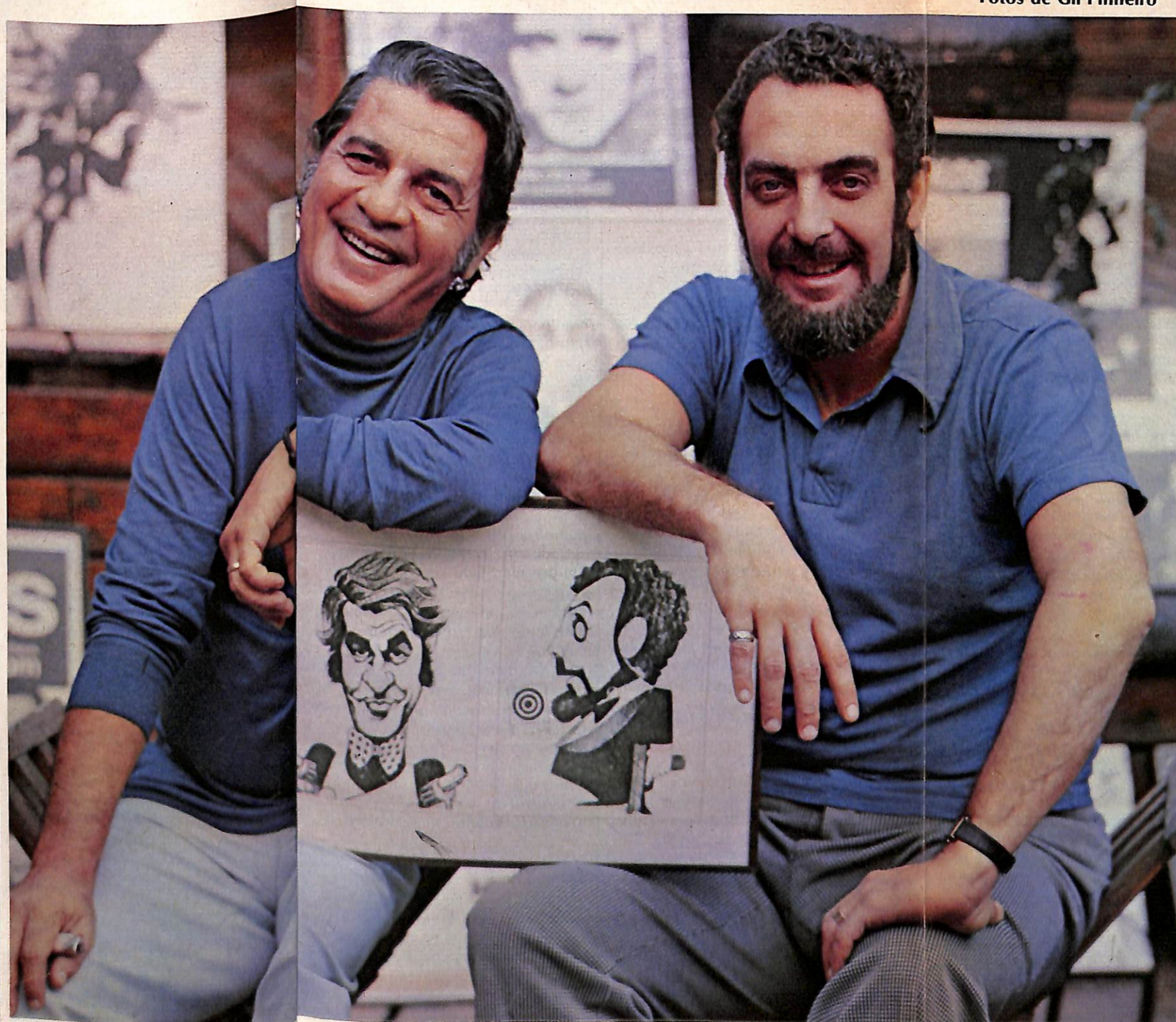
Hoje, a dupla trabalha na G... Como produtor, outro como ator. Quando se reúnem é para a carinhosa recordação dos muitos trabalhos realizados.