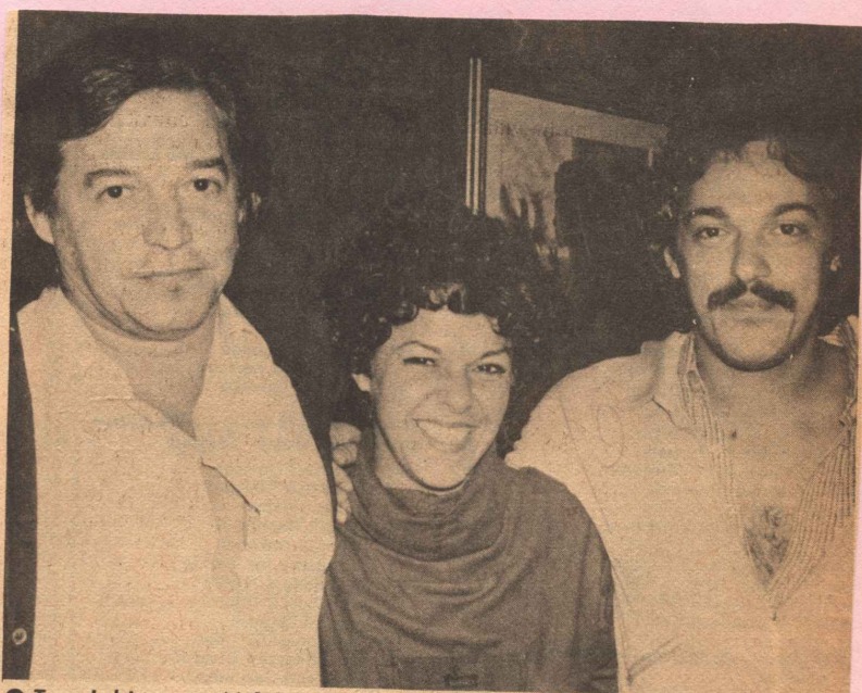
● Tom Jobim, com Miúcha e Toquinho, três das maiores expressões musicais brasileiras é porque não dizer internacional, reuniram-se num almoço no Castelo da Lagoa. Almoço que se estendeu até altas horas da noite. O assunto era o Canecão, onde, quando setembro chegar, deverão estreiar um sensacional show, que contará com a presença do não menos famoso Vinicius de Moraes .