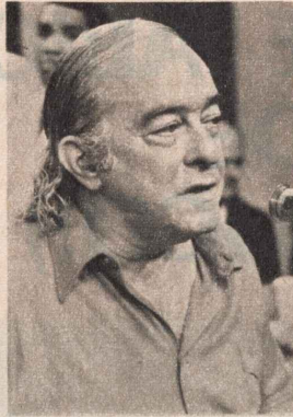
Vinicius de Moraes