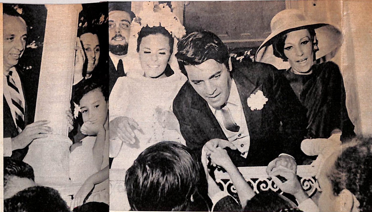
Em 1967, Böscoli se casou com Elis Regina.

de Nara Leão Diegues. Moça em quem não acreditei como cantora e