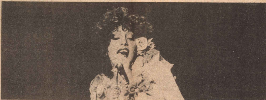
Dois shows em São Paulo e depois o exterior.