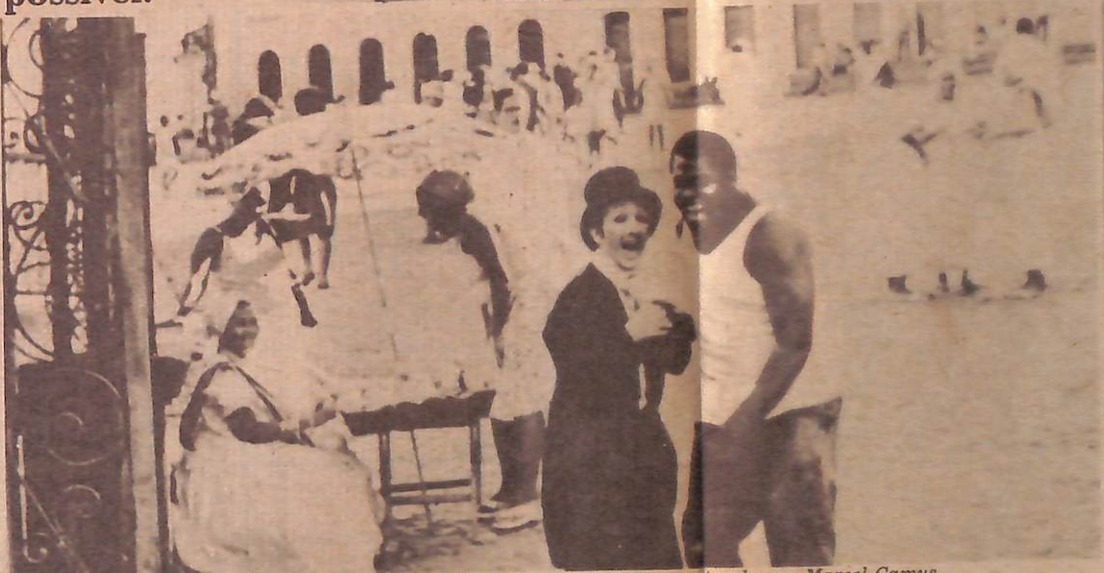
Os atores são tão mal dirigidos quanto a realidade é grosseiramente escamoteada por Marcel Camus.

O s Pastores da Noite (cines Metro 1, Gemini 2, Metrópole e Belas Artes) - A primeira reação, tanto do crítico como da plateia, é de absoluta perplexidade. Deve haver alguma confusão, não pode ser: que sentido terá esse grupo de pessoas pobres, negras (nem todas) e solidárias, bem alimentadas e tão ruidosamente felizes desfilando na tela? Todo o seu tempo é ocupado por festas e comilanças, todas as suas conversas começam e terminam entre garrafas de cachaça, todas as suas preocupações não sobem além do nível do umbigo.