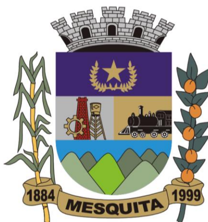
Figura 1: Brasão de Armas do Município de Mesquita.

Fonte: Retirado do website da Prefeitura de Mesquita.