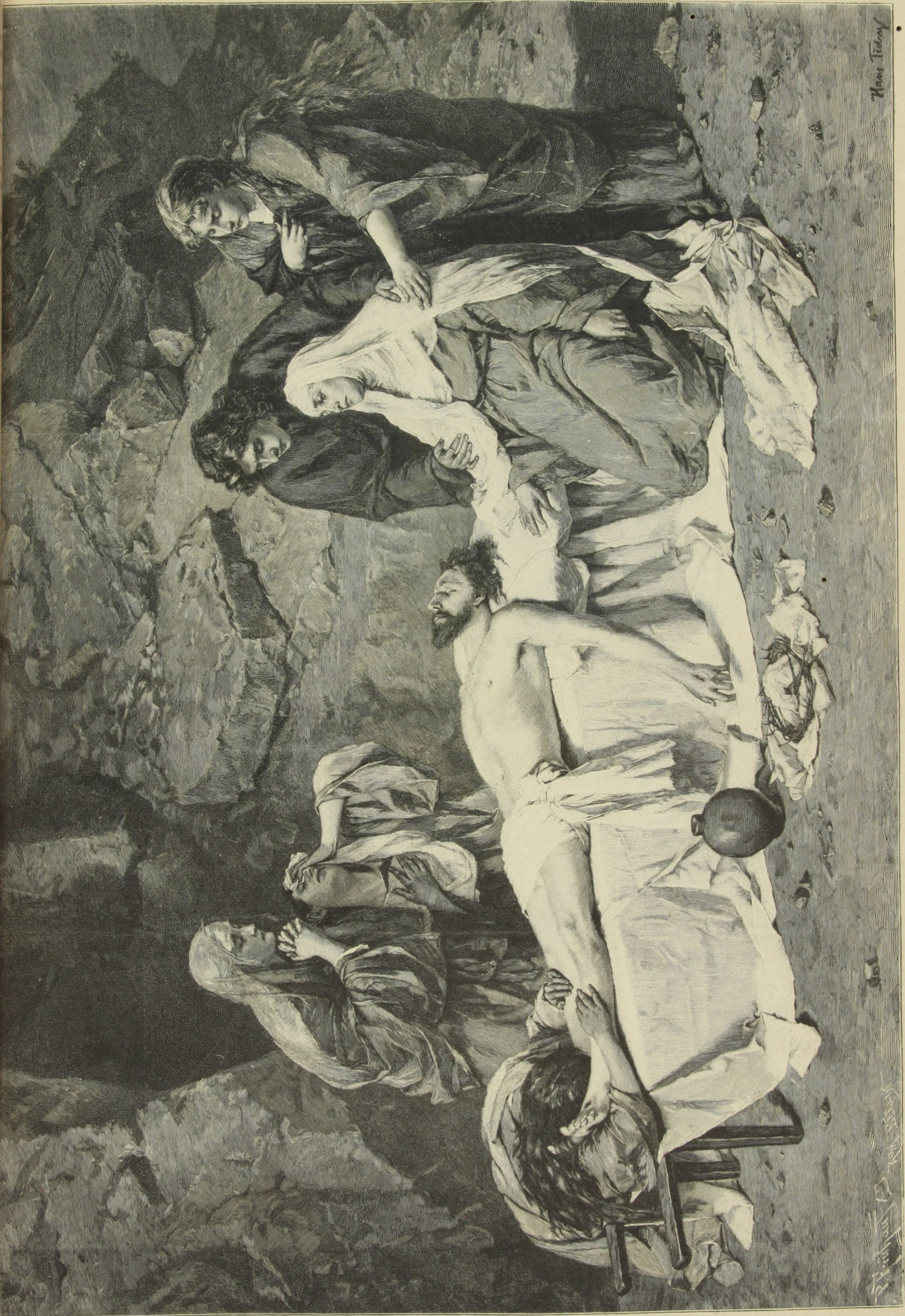
SEPULTURA DE JESUS CHRISTO